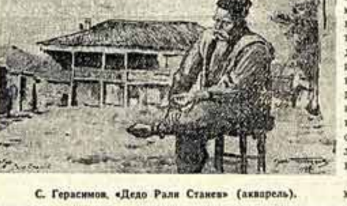
С. Герасимов. «Дедо Рали Станев» (акварель).

Колонизаторы держат народы Африки в темноте и невежестве. Детей, обучающих в школах, здесь меньше, чем где-либо в мире, процент же неграмотности — наибольший.