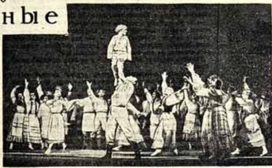
«Пламенные сердца». Сцена из третьего действия.

В первом акте обрамления у Л. Раженной поют дуэтом лирично, выразительно артисты скульптурно, выразительно, красиво. Но по мере развертывания сюжета в танце Раженной все отчетливее и отчетливее звучат ноты трагизма, трагичности, героики. Когда Янка грозит смертью Марии, Мария смело становится на защиту любимого. Она знает, что ждет ее у палачья-книжа, и все же жертвует собой, спасая жениха и его товарищей. Но и себя она легко не отдает в руки Маринки князя, и палачий князь отступает перед смелой девушкой.