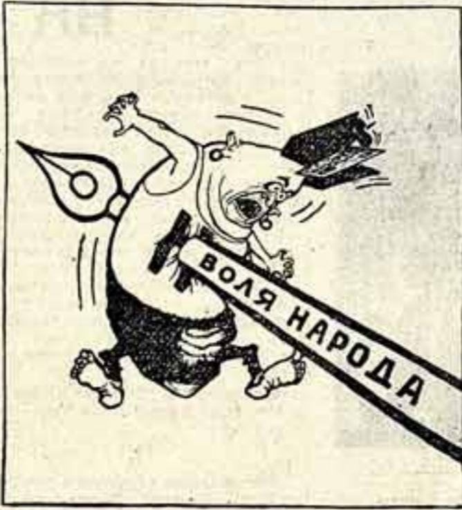
Подпишем Обращение Бюро Всемирного Совета Мира против подготовки атомной войны.

Обращение Всемирного Совета Мира о борьбе против угрозы атомной войны находит широкую поддержку среди народных масс всех стран мира.