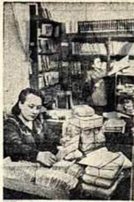
Украинская ССР. В апреле этого года исполнилось 125 лет со дня основания старейшей в республике Одесской государственной научной библиотеки имени Горького. В ее фондах насчитывается около двух миллионов книг, среди них — редкие издания классиков мировой литературы, много книг, вышедших своим полиграфическим оформлением.

Интересы коммунистического строительства требуют увеличения издания литературы по новейшим проблемам физики, химии, математики, биологии, во всех отраслях науки, имеющим огромное значение для развития народного хозяйства страны. Необходимо сделать достоянием советских читателей все лучшее, что создано человечеством в области науки и техники. Каждая научная книга должна в полную меру соответствовать достижениям современной науки в СССР и за рубежом.