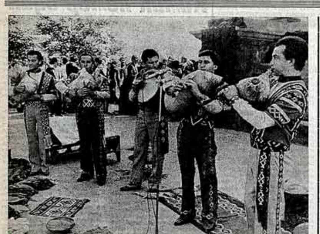
Традиционный фестиваль «Гарин-Б» — смотр народного творчества — состоялся на огромной поляне возле храма Гарина, архитектурного памятника I вена, расположенного неподалеку от Бржана. Праздник собрал около ста лучших советских музыкальных коллективов республик, мастеров народного искусства и ремесел.

В этом эссе-рецензии «Гамлет» много смешного. Например, группа прибывших в Эльсинор актеров полагается на сцене, держа в руках белых кукол, еще меньше, чем сами державшие, — это смешно.