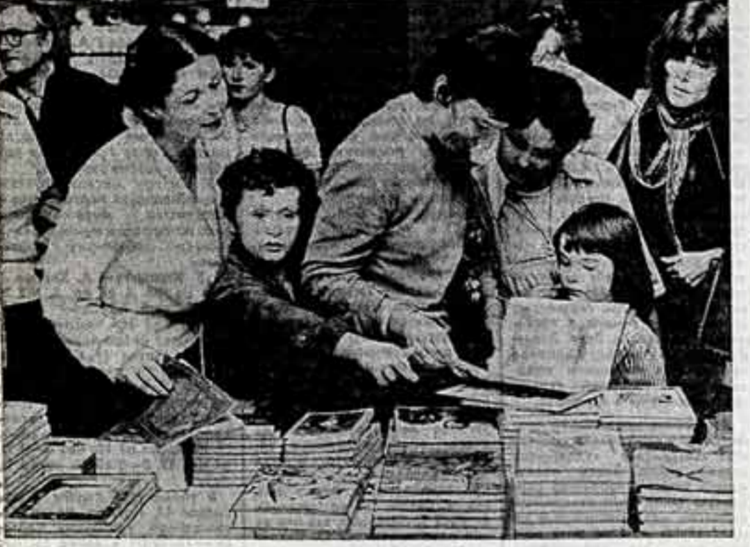
ГДР становится одной из самых читающих стран мира. Особая забота уделяется в республике литературе для подрастающего поколения. Ежегодно, сообщает агентство ТАСС, издается 600 наименований книг для детей и юношества тиражом в 17 миллионов экземпляров. В ФРГ берлинского театра — продажа книг, вышедших в издательстве «Индарбухверлаг», которое отмечает в этом году свое 35-летие.