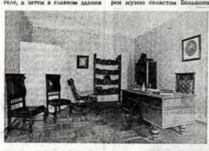
Музей-усадьба М. П. Мусоргского.