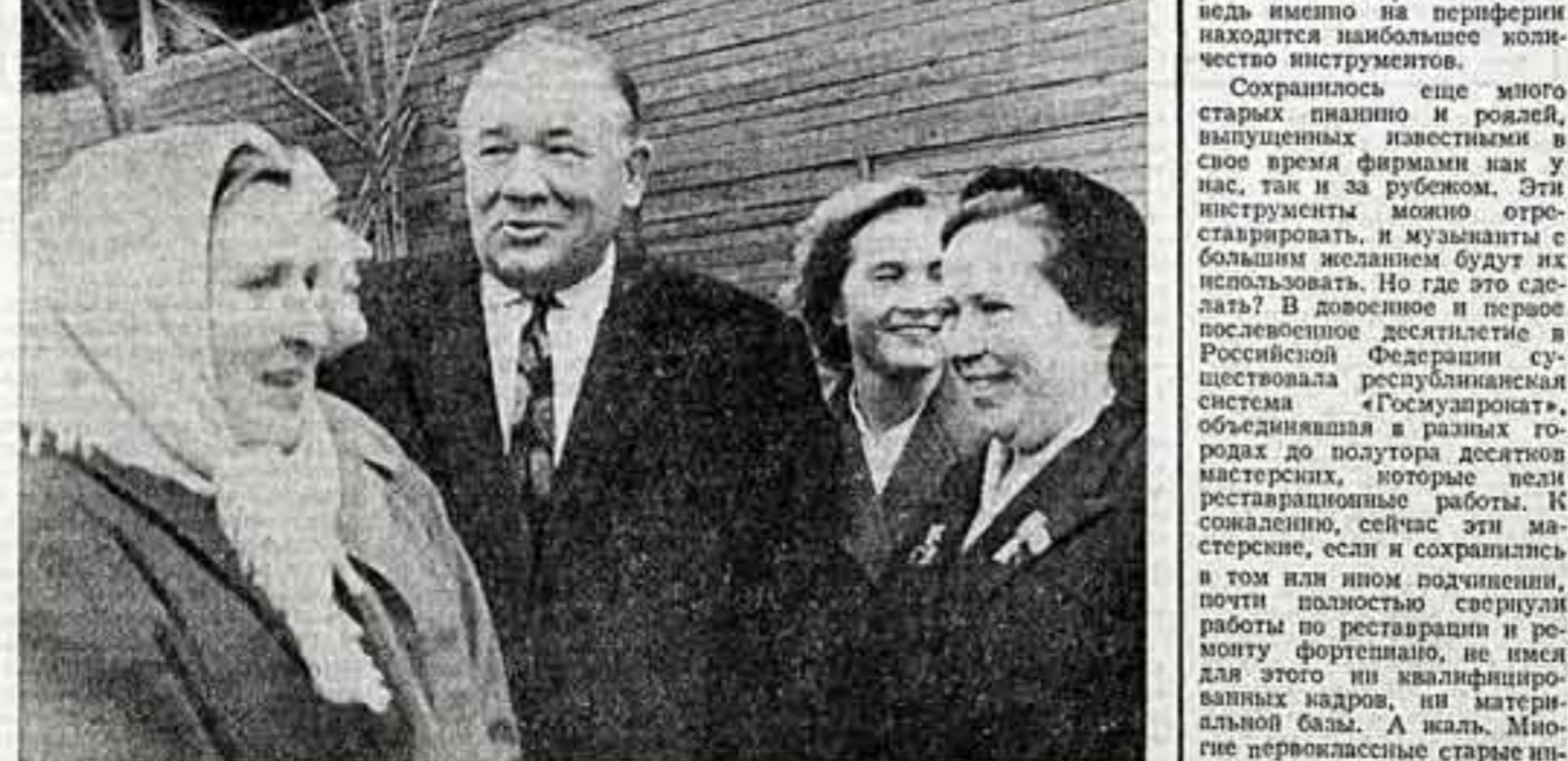
А. КНЯЗЕВ, Народный артист СССР Борис Андреев во время гастролей в Рязани побывал в строителях города, в бригаде Героя Социалистического Труда Анны Ивановой. (60-е годы).