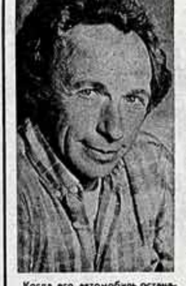
Когда его автомобиль останавливается перед светофором, водители соседних машин высовываются, чтобы с ним поздравиться. Проложено обращается к нему на улице просто по имени: «Привет, Пьер!»

«Высокий блондин Пьер Ришар — в реч и идет именно о нем (правда, в жизни его скорее можно встретить в спортивных топках, чем в «черном ботинке») — нинуть не обижается на такую фамильярность. «Я не звезда», — часто повторяет он в своих интервью, — популярный, народный актер. Неудивительно, что публика относится ко мне более тепло, чем к другим популярным артистам, тем, кто в точности такой, как все. Я тоже обыкновенный человек, довольно скромный и стеснительный. У меня нормальная семья: двое детей, мальчишек. В моей жизни нет ничего необычного».