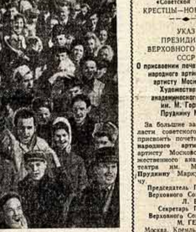
Фотосъемка «Наша молодость».