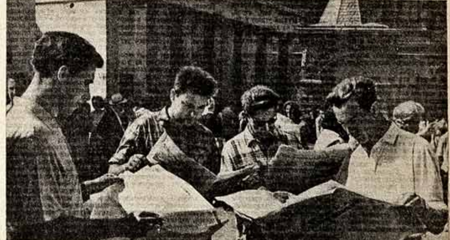
Этот снимок сделан фотокорреспондентом Р. Федоровым у газетного киоска на площади Революции в Москве. Москвичи с большим интересом встретили опубликованный проект Программы Коммунистической партии Советского Союза.