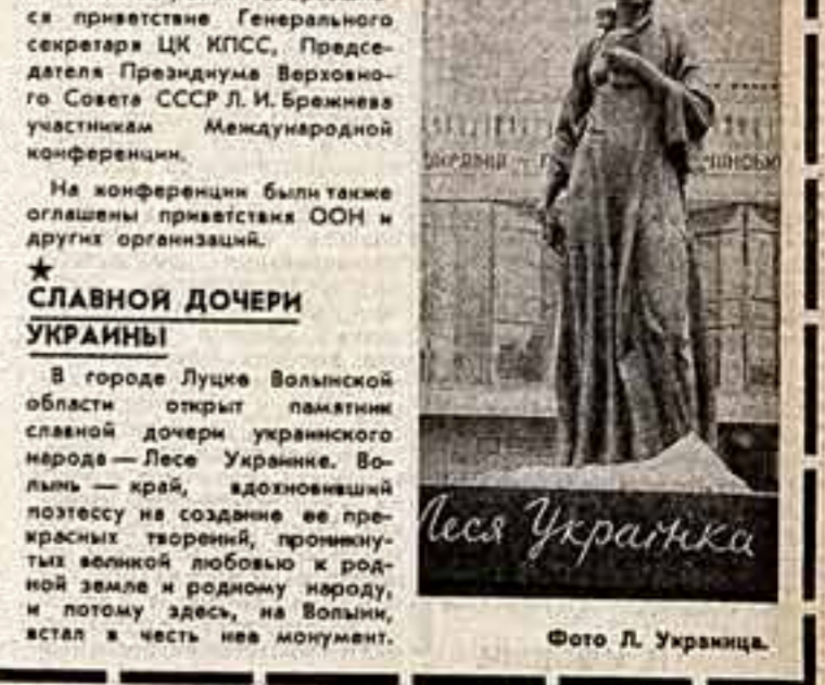
Меся Украина.

Создатели памятника — скульпторы А. Нименно и Н. Обезюев, архитекторы В. Жигулин и С. Кивасов.