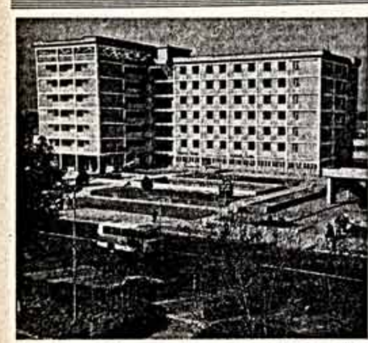
Курган-Тюбинская область — самая молодая в Таджикской ССР. Тысячи жителей селенных домов собираются в библиотеки, современные театры культуры, музеи. В областном центре — Курган-Тюбе открыт Государственный театр музыкальной комедии. А последняя новостройка в Курган-Тюбе — новела гостилица.