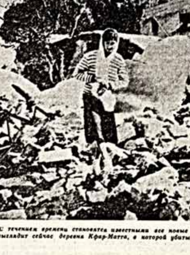
С течением времени становится известными все новые факты ливанской трагедии. Так выгладит сейчас берега Край-Матта, в которой убиты 117 стариков, женщин и детей.

А. ПАЛЛАДИН, соб. корр. «Искусство», специально для «Советской культуры», САН-ФРАНЦИСКО — ВАШИНГТОН.