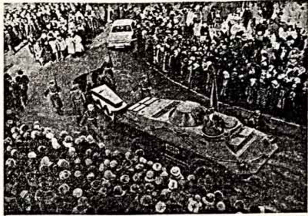
Михаил Александрович Шолохов. Мы, рабочие завода «Урал», всегда видели в нем настоящего сына Советской страны, раздвоенным сердцем востраженным к любимым писателям, нашим землякам, гордящимся, что несколько десятилетий Михаил Александрович представлял нашу историю, интересы всего трудового народа. Он всегда был в боевом строю, на боевом посту.

При всей своей огромной занятости Михаил Александрович постоянно интересовался делами нашего трудового коллектива, жизнью и работой комбайнстроителей, часто встречался с ростсельмашевцами. И эти встречи всегда придавали нам новые силы, энергию, вдохновляли на новые трудовые успехи. Невозможно измерять и оценить, что дадут книги Шолохова нам, советским людям. Из них, как из источника, как человеческого мудрости, мы черпаем науку сыновней любви и Родины и родной земле. Из этого источника мы черпаем науку борьбы за народное счастье, науку глубокой преданности и высокой ответственности за порученное дело.