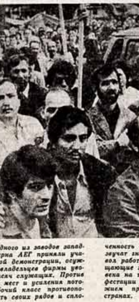
Тысячи рабочих одного из заводов западногерманского концерна АЕГ приняли участие во впечатлительной демонстрации, осуждающей намерение владельцев фирмы сократить рабочие места и усилить авторитарную систему рабочих классов противоположностью своих сил. На митингах протеста звучат известные голоса, осуждающие произвол работодателей, звучат лозунги, требующие элементарных прав каждого человека на труд. Забастовка в Борне, митинг в Бельгии и марши стали убедительным оружием протеста в капиталистических странах.