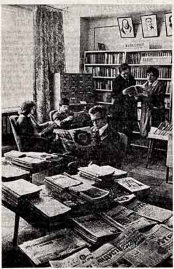
На московском заводе «Станкоормаль» отличная работа коллектива во многом обеспечивается успешными решениями социально-бытовых задач. Это в значительной мере способствует формированию хорошего психологического климата на предприятии.