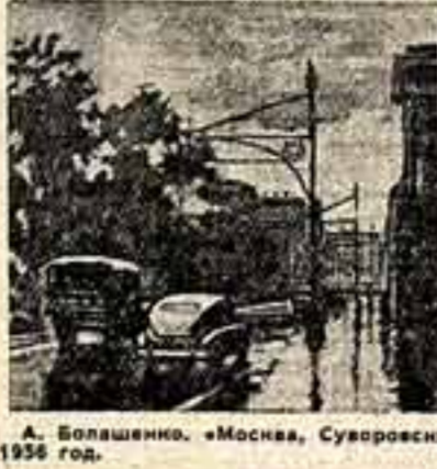
А. Болшенко. «Москва, Суворовский бульвар, 1936 год».

Групповые выставки молодых художников, устраиваемые Академией художеств СССР в своих залах, всегда привлекают к себе внимание зрителей. Итересной была третья выставка работ молодых. Животпись пред-