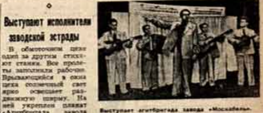
Выступают артисты завода «Агроброад» Москва