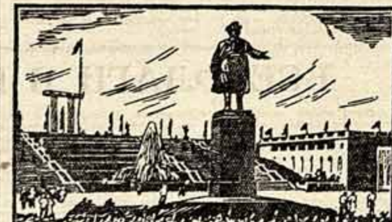
Монумент в Ленинградском парке культуры и отдыха.

О, кто она? Любовь, Харита, Ели перли для страны иной Эдем покинула родной, Тончайшим облаком обоняла!