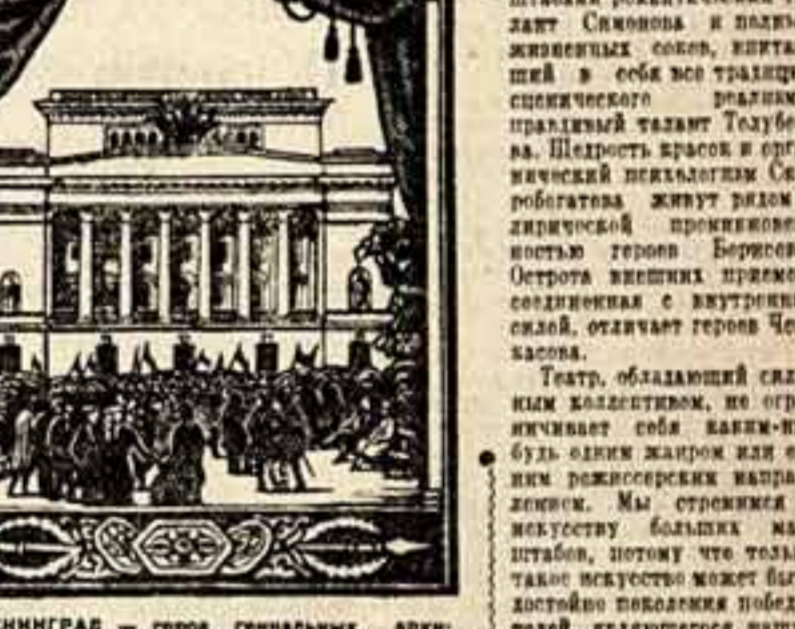
ЛЕНИНГРАД — город гениальных архитектурных ансамблей. И те из них, которые созданы Баро Росси, принадлежат к числу наиболее примечательных. Изображение на гравюре удивительно похоже на здание Александринского театра. В нем вошел педагог, актер и переводчик Иван Дмитриевский. С их помощью были созданы первые зерна будущей русской театральной культуры. Эти зерна дали свои ростки.

Общественное гражданское начало русского искусства определяло тот уровень, которым пользовался театр у своих современников. Он жил не теми декорациями, которыми пользовались театры в то время, а теми идеями, которые он нес в сердцах зрителей. Это искусство определяло тот уровень, которым пользовался театр у своих современников. Он жил не теми декорациями, которыми пользовались театры в то время, а теми идеями, которые он нес в сердцах зрителей.