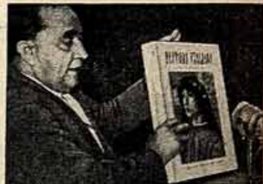
Джованни Вальдари передает в подарок советским коллегам образцы продукции итальянской полиграфической промышленности в Центрально-доме работников искусства.

Гостиная медленно в Советском Союзе по приглашению ЦК профсоюз работников культуры делегация итальянских полиграфистов побывала в различных предприятиях Москвы и Ленинграда, посетила социально-бытовые учреждения, библиотеки, музеи, дворцы культуры, ознакомилась с деятельностью профессиональных организаций. Глава делегации — Генеральный секретарь Итальянской Федерации трудящихся полиграфической и бумажной промышленности Джованни Вальдари, делая впечатления от пребывания в СССР, сказал в беседе с корреспондентом «Советской культуры»: