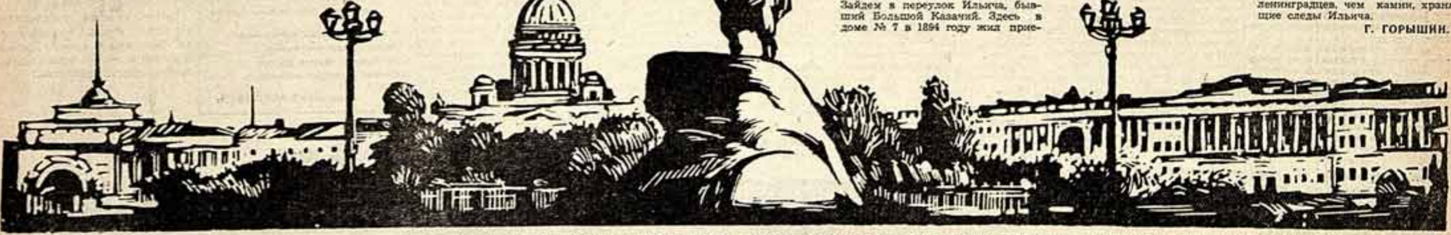
ТВОРЕНИЕ ПЕТРА... Оно возникло на берегах Невы, как символ народного таланта, его титанической труда, его мужества. Столица России — она явила миру не только государство, но и великий гражданин земли русской.

Здесь каждый камень Ленина знает... Камень обновляется, молодеет. Преобразуемая рука времени шадит лишь бесценные ленинские реликвии. Вот она, маленькая кампалата, на Большом Какачьем.