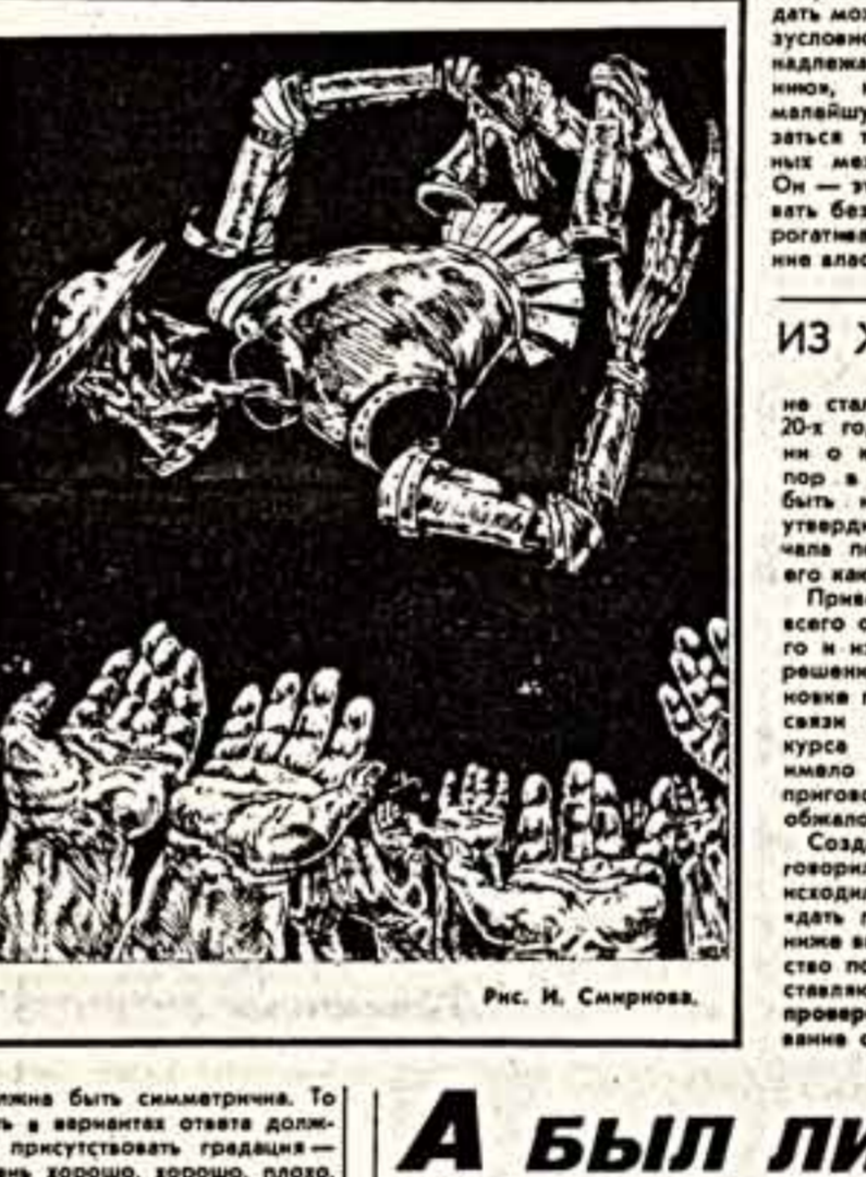
Рис. И. Смирнова.