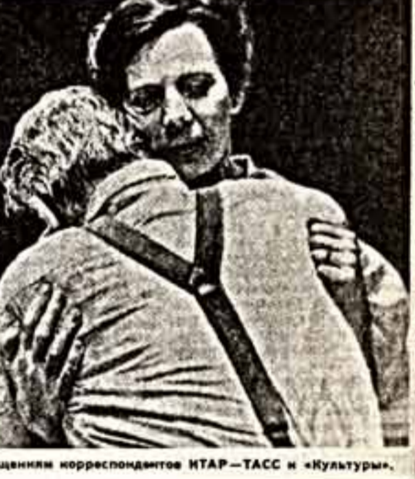
По сообщению корреспондентов ИТАР-ТАСС и «Культур».