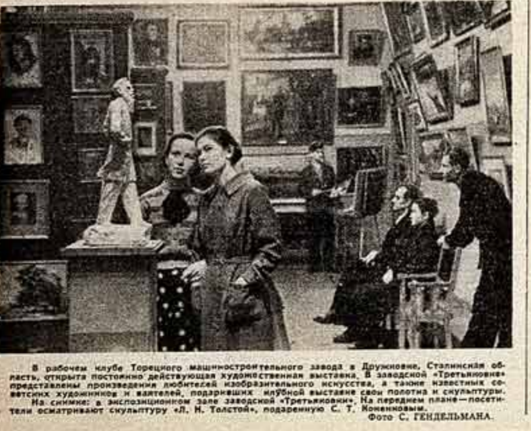
В рабочем клубе Тороского машиностроительного завода в Дружбине, Сталинская область, открыта постоянно действующая художественная выставка. В экспозиции представлены произведения мастеров изобразительного искусства, а также известных советских художников и учителей, подаривших клубу выставку своих работ и скульптуры. На снимке: в экспозиционном зале заводской «Третьяковки». На первом плане — посетители рассматривают скульптуру «Д. Н. Толстой», подаренную С. Т. Понявину.

В Багдаде состоялось подписание советско-иракского плана культурного обмена на 1961 год. План предусматривает конкретные мероприятия по выполнению соглашения о культурном сотрудничестве между Советским Союзом и Иракской Республикой, такие, как обмен учителями, преподавателями, студентами, артистами, спортсменами, а также литературой, научно-технической информацией, радио- и телевизионными программами. Советский Союз примет до 470 иракских студентов. При подписании главы делегаций обменялись дружескими речами. «Стороны», — подчеркивается в совместном коммюнике, — заявили о своем намерении принять всевозможные меры к тому, чтобы этот план был выполнен полностью. Стороны выразили надежду, что подписание этого плана является важным фактором на пути укрепления культурных отношений между двумя дружественными странами».