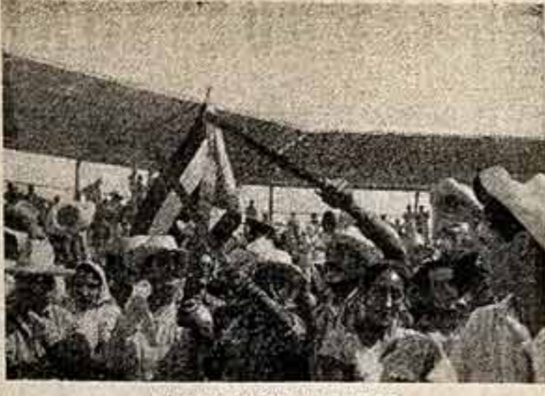
Крестьяне собрались на митинг.

Но можно ли прожить мимо бесконечной по размаху созидательной работы революционного народа! Мимо новых домов, где семья крестьянина встречает свет, уют и все удобства, яркие, веселые краски. Мимо поднимающиеся на дня в день городские жилые дома легкой современной архитектуры.