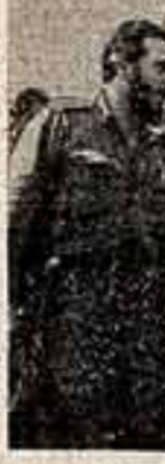
Фидель Кастро.