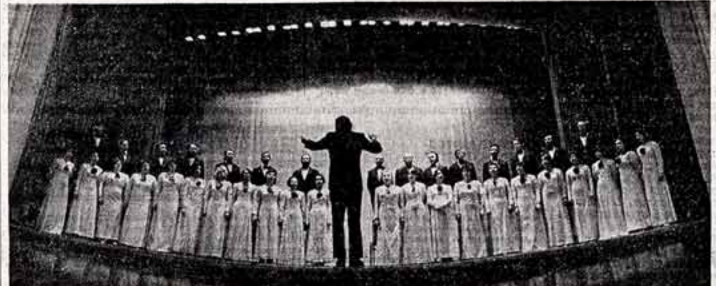
В Пензенском дворце культуры им. Кирова ведется большая работа по идеологическому воспитанию трудящихся. Регулярно читают здесь лекции по марксистско-ленинской эстетике, по вопросам коммунистической морали и высокой культуры поведения. Около двух тысяч человек занимаются в коллективе художественной самодеятельности. Регулярно читают здесь лекции по марксистско-ленинской эстетике, по вопросам коммунистической морали и высокой культуры поведения.