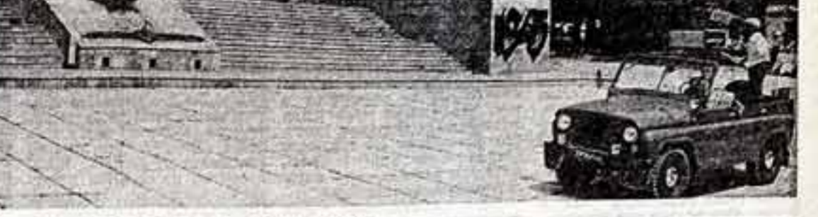
ТВ: ВЕСТИ СО СТУДИЙ ИЗ ВЕКА XX В ВЕК XVIII