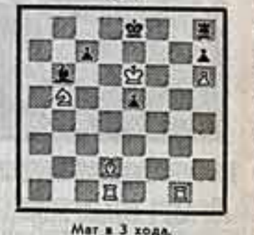
Мат в 3 хода.

Вместе с ответами (на отдельные открытки в течение 10 дней) просим прислать свои отзывы о летней части нашего конкурса, рассказывать о себе.