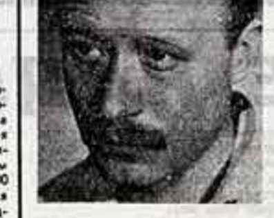
Известным детским писателем Борису Житкову и Корнелию Чуковскийю посвящен новый двухсерийный художественный телефильм, который под условным названием «Я жил тогда» снимают «Яксы» киностудию.