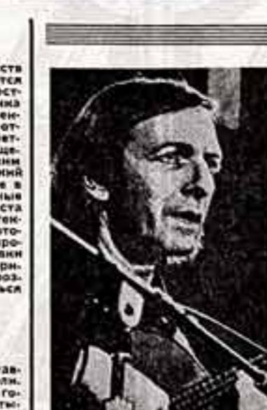
И вот и в зале. Мало сказать, что он забыл до отказа. Публика заполнила все проходы, расползалась по лужайке, по полу, у стены...