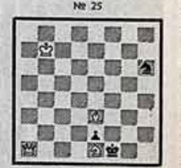
Мат в 2 хода.