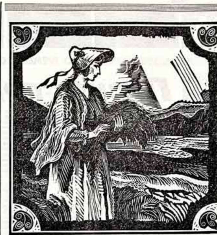
В издательстве «Молодая гвардия» готовится к выходу книга М. Подгорного «Нам первый вольность прощала» об Александре Радцеве.

Как-то в Доме культуры меня позвонила известная художница. Он был так занят, что не мог выдать мне себя ни слова. Художник посмотрел на меня внимательно, словно изучая мое лицо, и потом решительно сказал: — Я хочу написать ваш портрет.