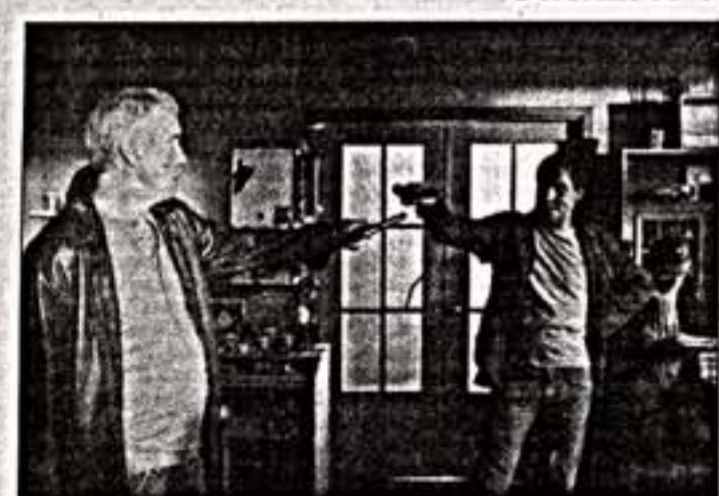
На съемочной площадке