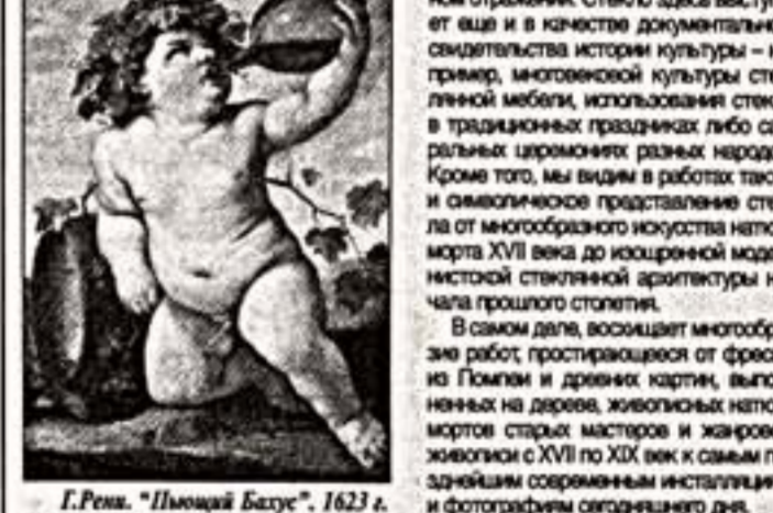
Г. Рема. "Плохой Батус", 1623 г.