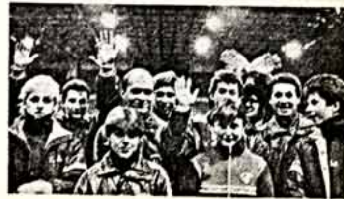
Группа советских участников турнира.