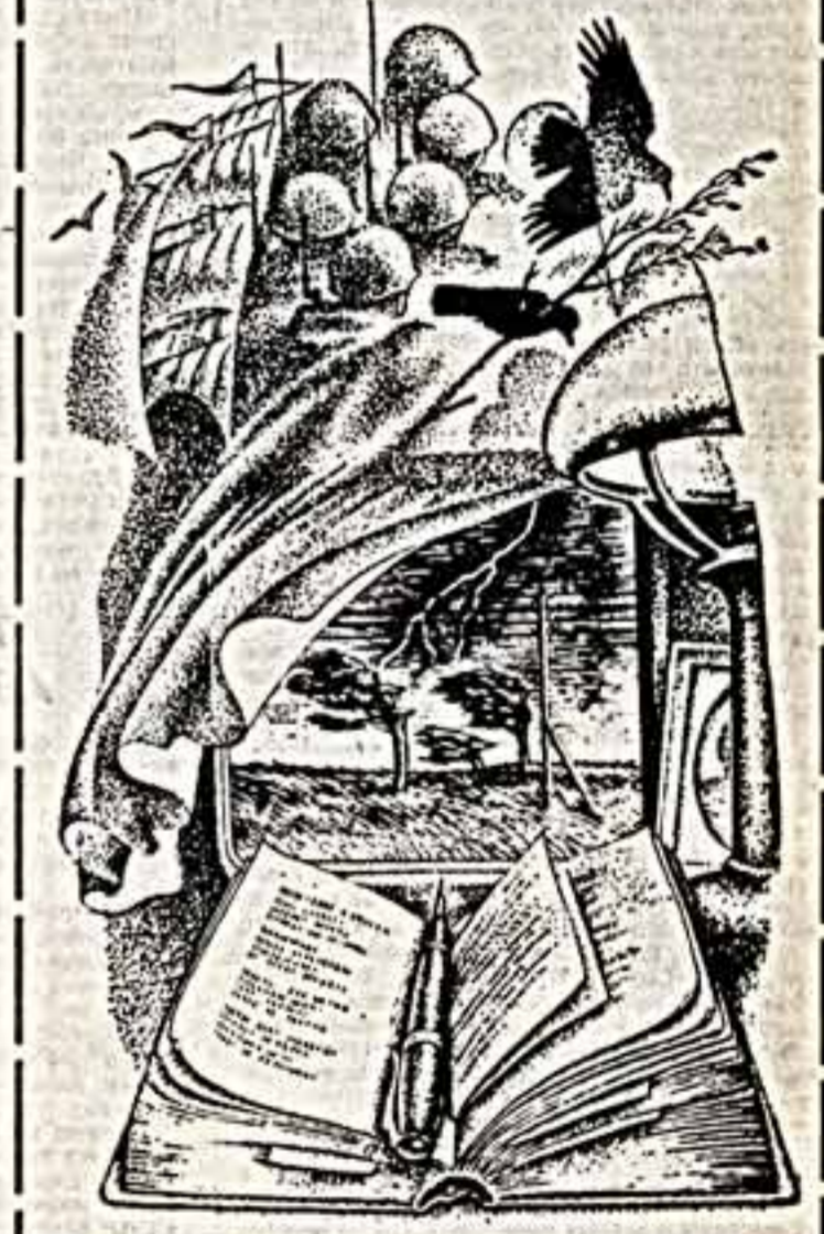
В издательстве «Современник» готовится к выходу в свет сборник стихов Михаила Шенгелова «Слова наместника, слово Азурное». Иллюстрация к этому изданию выполнил художник Николай Кошкин.