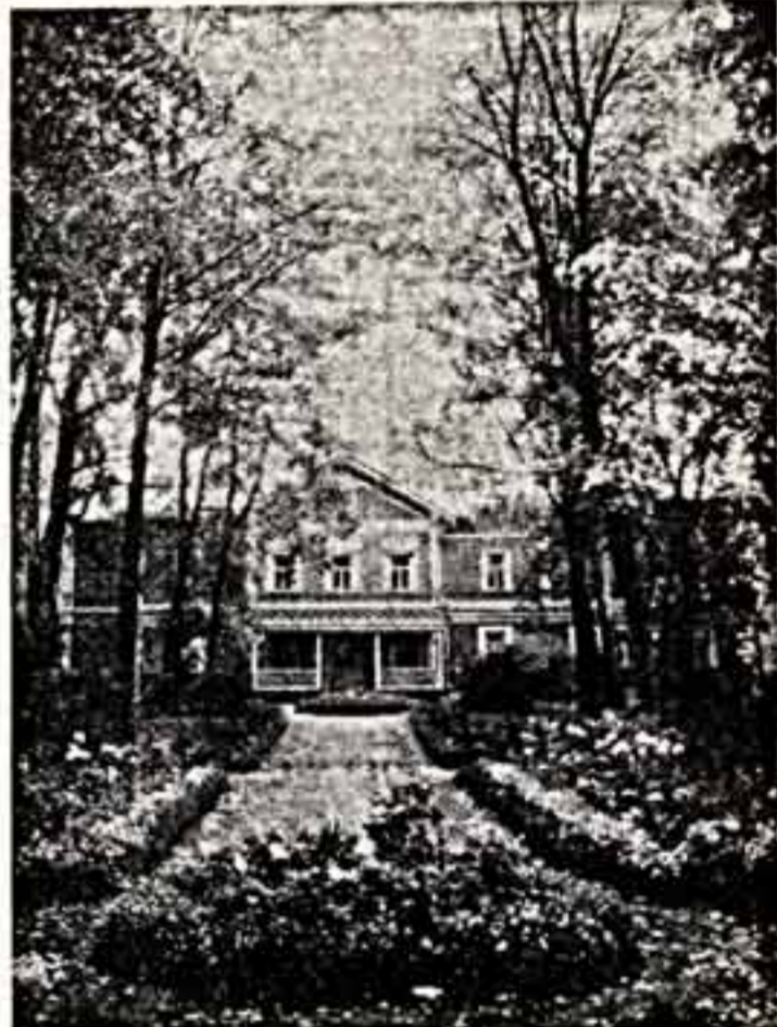
Дом-музей П. И. Чайковского в Каму.