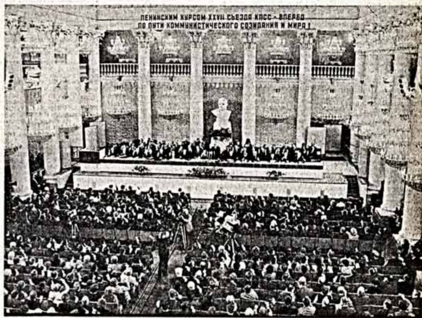
Во время открытия Учредительной конференции Советского фонда культуры.

Руководители братских партий обсудили кардинальные проблемы развития и совершенствования сотрудничества между социалистическими странами, возможности более полного раскрытия созидательного потенциала социализма. Особое внимание было уделено дальнейшему углублению отношений в экономической области, использованию новых, наиболее прогрессивных форм хозяйственного и научно-технического взаимодействия в интересах ускорения социально-экономического развития братских стран, повышения благосостояния их народов. Состоялся обмен мнениями по актуальным вопросам современной международной обстановки. Поддержав принципиальную позицию Советского Союза в Рейкьявике, участники встречи подчеркнули необходимость наращивания совместных усилий в интересах борьбы за ликвидацию ядерных и сокращение обычных вооружений, за упрочение мира и международной безопасности. Встреча прошла в атмосфере сердечности и открытости, взаимопонимания и единства по всем обсуждавшимся вопросам. (ТАСС)