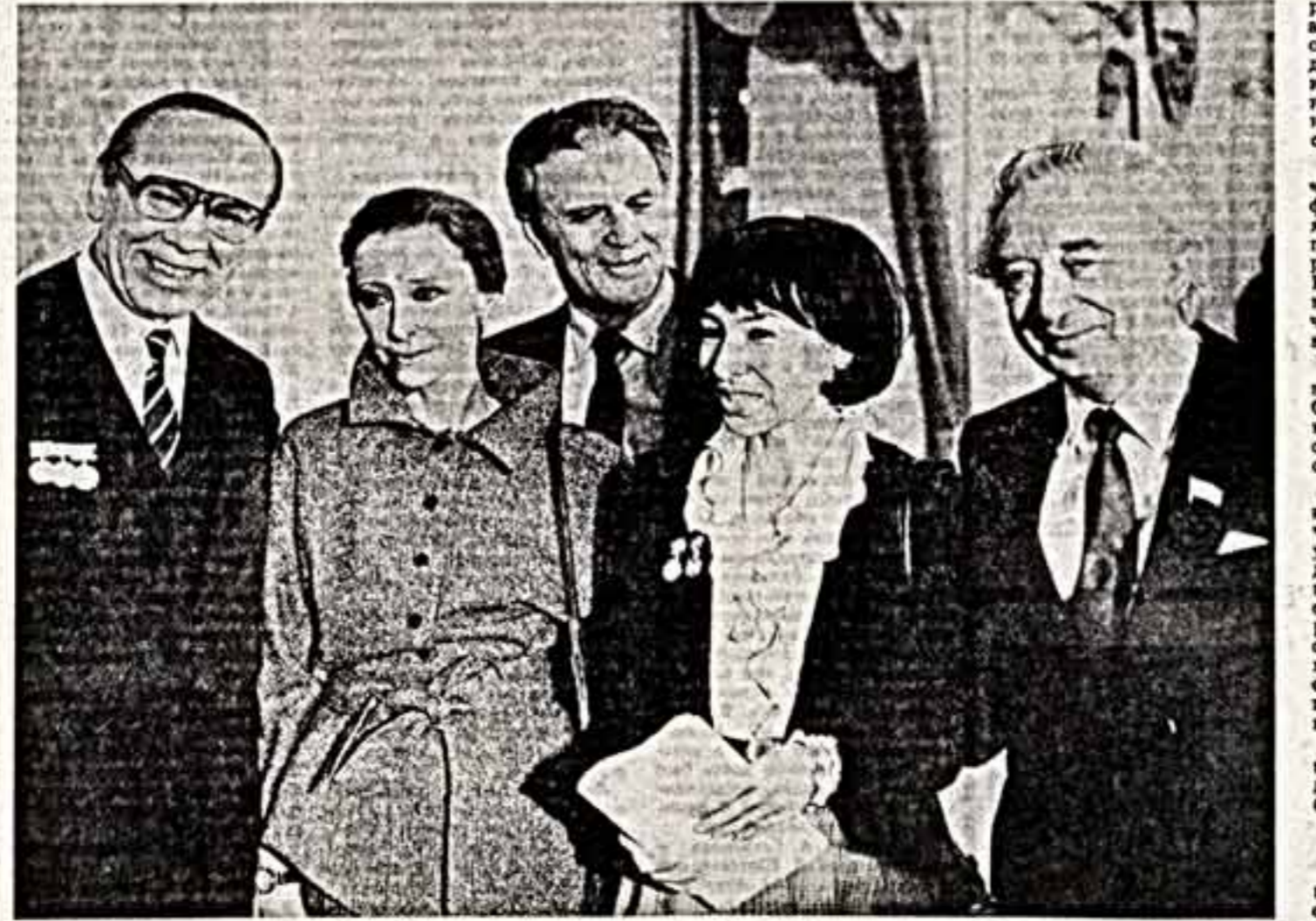
В первом между заседаниями: народный артист УССР А. Носков, народная артистка СССР М. Павсюк, народный артист БССР Н. Крелево, народная артистка СССР Б. Кариев и народный художник СССР Е. Угров.