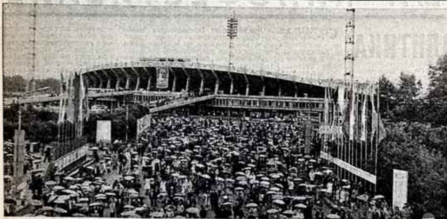
На Центральной стадионе имени Ленинского комсомола в Красноярске.