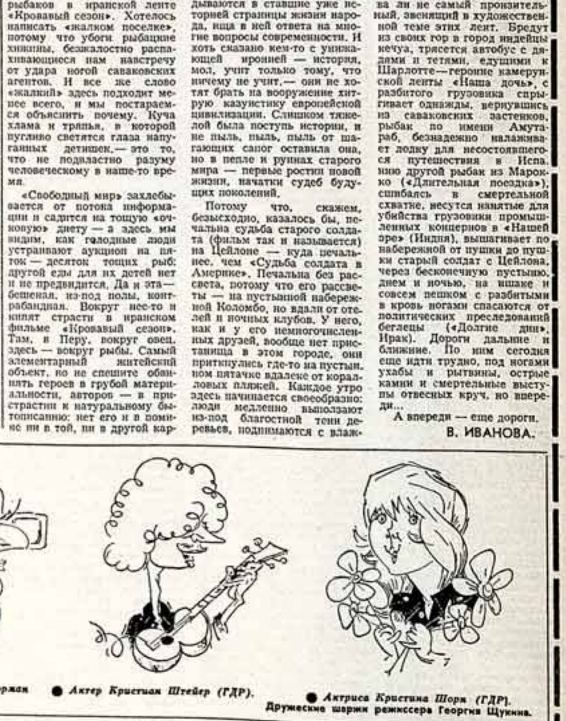
Актер и режиссер Эрдэн-булсан Лаява (МНР). Режиссер Стэнли Форман (Великобритания). Актер Кристиан Штейер (ГДР). Актриса Кристиана Шора (ГДР). Дружеские шарики режиссера Георгия Щуркина.