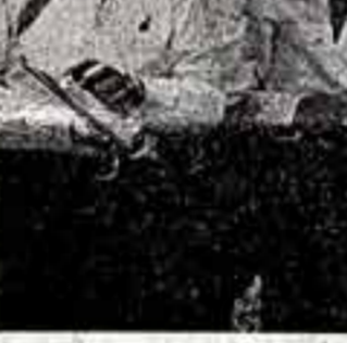
На XII Международном кинофестивале в Москве. Пионерское жюри конкурса фильмов для детей.