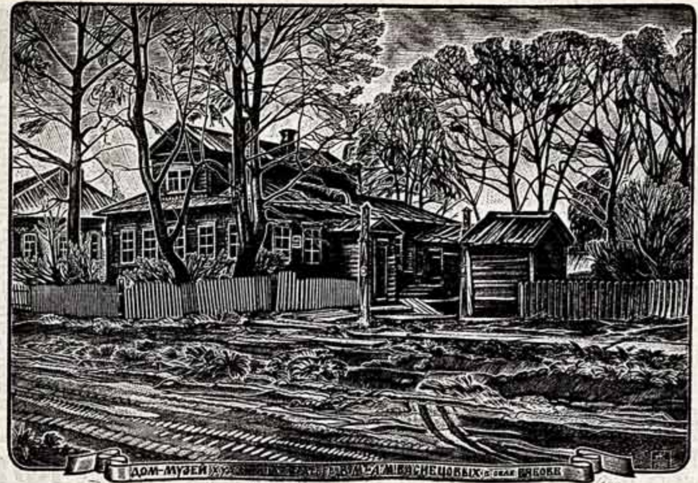
ДОМ-МУЗЕЙ БРАТЬЕВ В. М. И А. М. ВАСНЕЦОВЫХ В СЕЛЕ РАБОВО

Международный летний фестиваль танца в Неран (Италия) отбыла группа артистов балета Ленинградского театра оперы и балета имени С. М. Кирова.