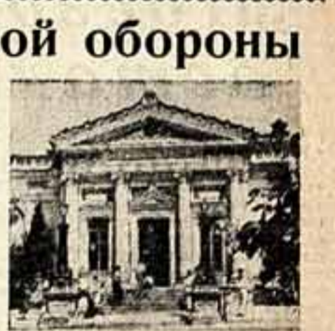
У здания Музея Черноморского флота.