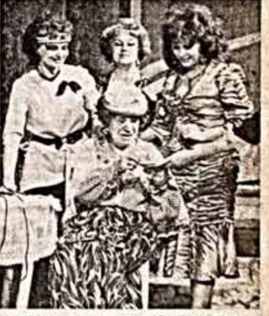
Сцена из спектакля «ОБЕЖ» В. Пущача. Русский драматический театр им. В. Маяковского, Душанбе.

При хозрасчете успех театру обеспечен, если он не будет иметь своего постоянного помещения и станет жить отныне на самые злободневные проблемы дня, — так считает директор театра В. Тарасов.