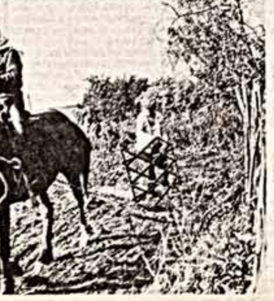
Вот моя деревня, вот мой дом родной...