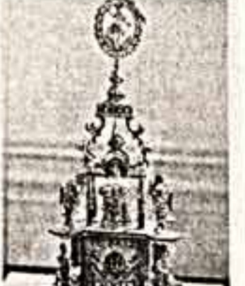
МОСКВА. С новыми открытиями реставраторы знакомят посетителей, открывшаяся в выставочном зале Советского фонда культуры на улице Карла Маркса, 15.

Как сообщили в Ереванском отделении нелегальной дороги, 8 октября в Армению через Азербайджанскую железную