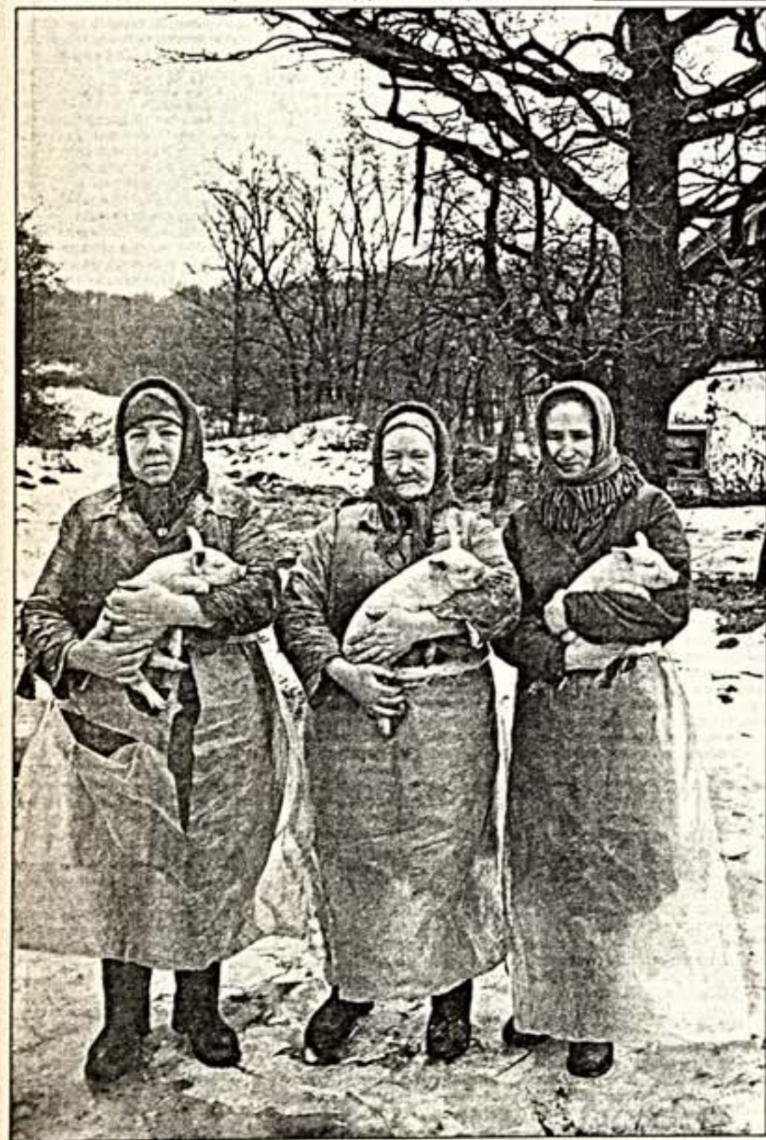
"Сайбарка". Орловская область, 1986 г.