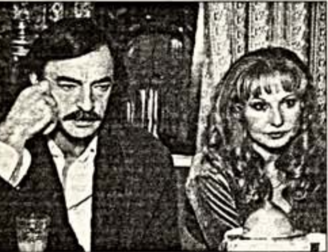
Кадр из фильма: Л.Луплиан и М.Боярский — супруги в жизни и на экране

Артиста под день рождения оценили в миллион долларов