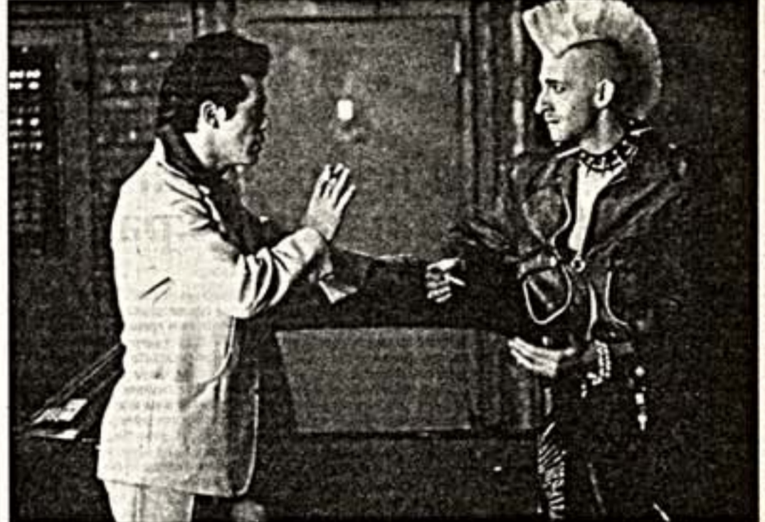
Кадр из фильма: Винни и Ритчи пока еще друзья