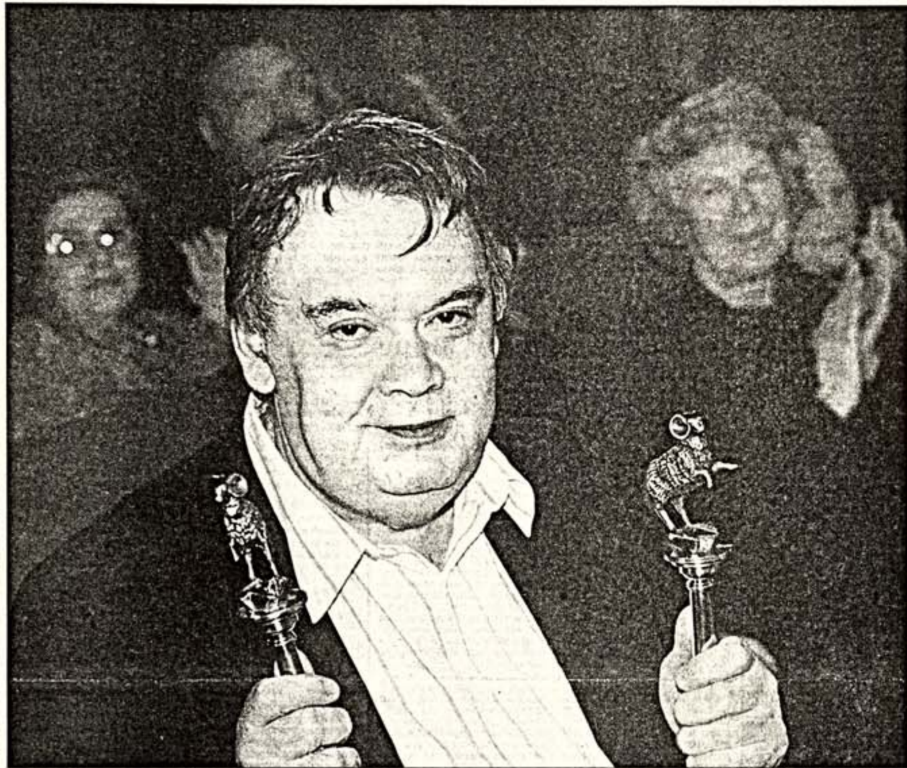
Алексей Герман с "Золотым Овном"

В минувшую субботу, накануне парламентских выборов, свой выбор огласили кинематографисты. В кинотеатре "Ударник" состоялось вручение Национальной премии киноритики и кинопрессы "Золотой Овн" за 1999 год. Люди искусства пришли на церемонию во множестве, чего не скажешь об иных, даже самых престижных киномероприятиях. А вот политических деятелей на небосклоне не наблюдалось, в эту субботу они, видимо, готовились к своему "кино". Даже Владимир Путин прислал свое приветствие устроителям и участникам церемонии после воскресных думских выборов. В 13 номинациях, за исключением трех зарубежных, фигурировали один и те же фильмы, отобранные из сорока с лишним картин, произведенных у нас в стране за год. Алексей Герман, долго скрывавший от кинокритических