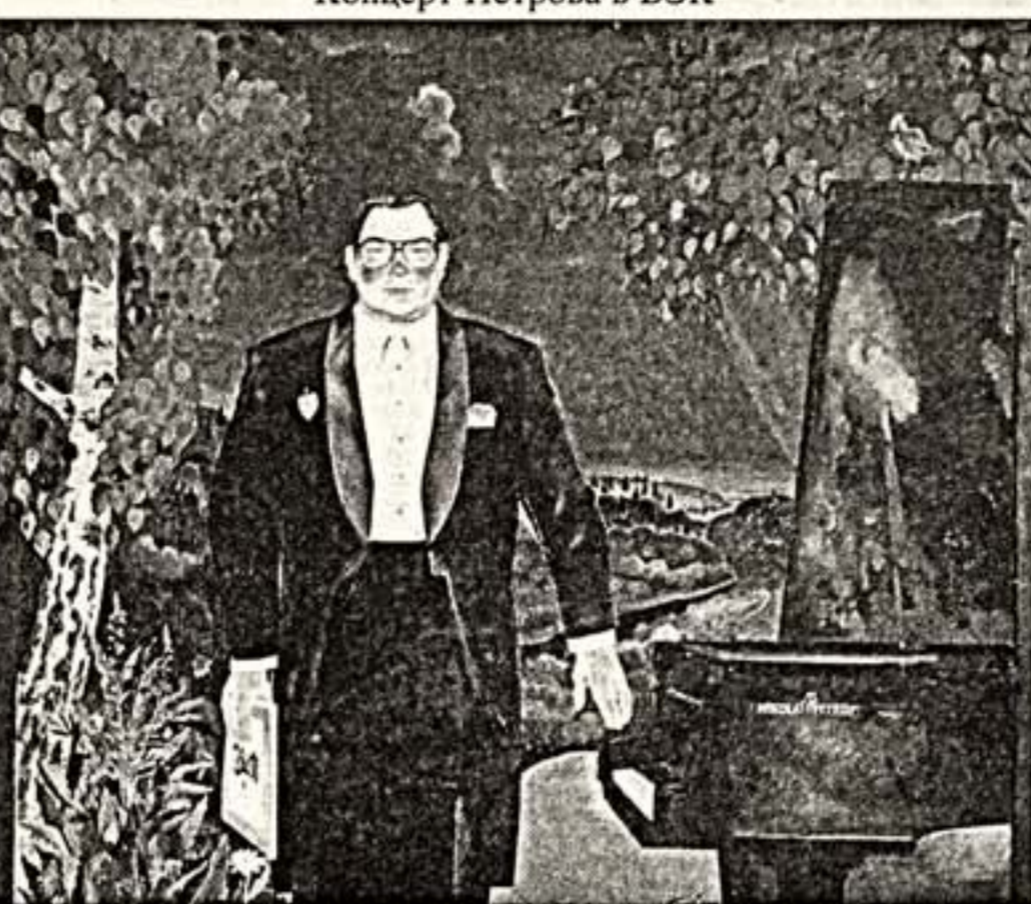
Портрет пианиста Н.Петрова кисти О.Саавостюка