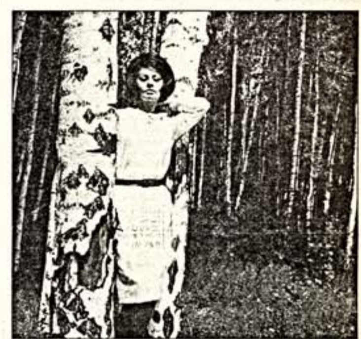
"Прощание с Россией" (Софи Лорен)