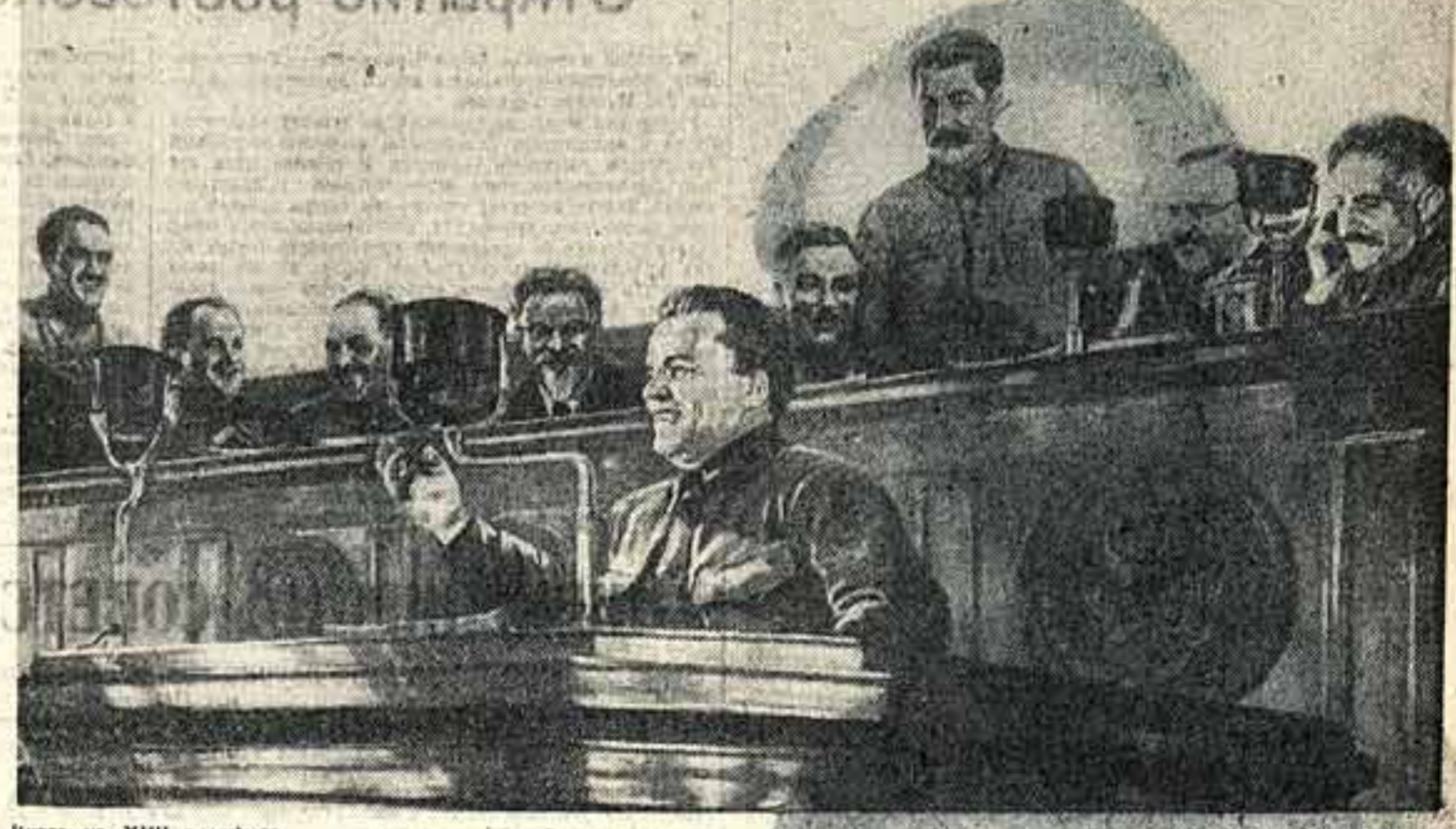
Киров на XVII партсъезде