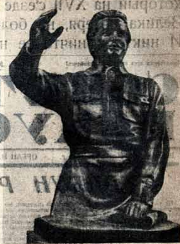
Киров на трибуне. Скульптура Валентина