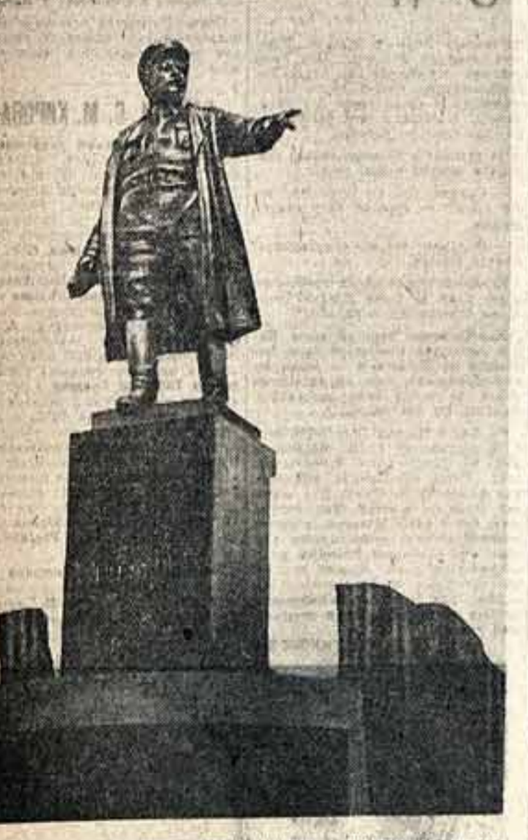
В Ленинграде открылась выставка конкурсных проектов памятника Сергею Мироновичу Кирову...