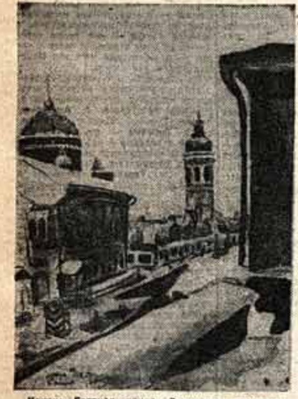
Урумчи. Главная улица. Зарисовка художника И. Ф. Осипова