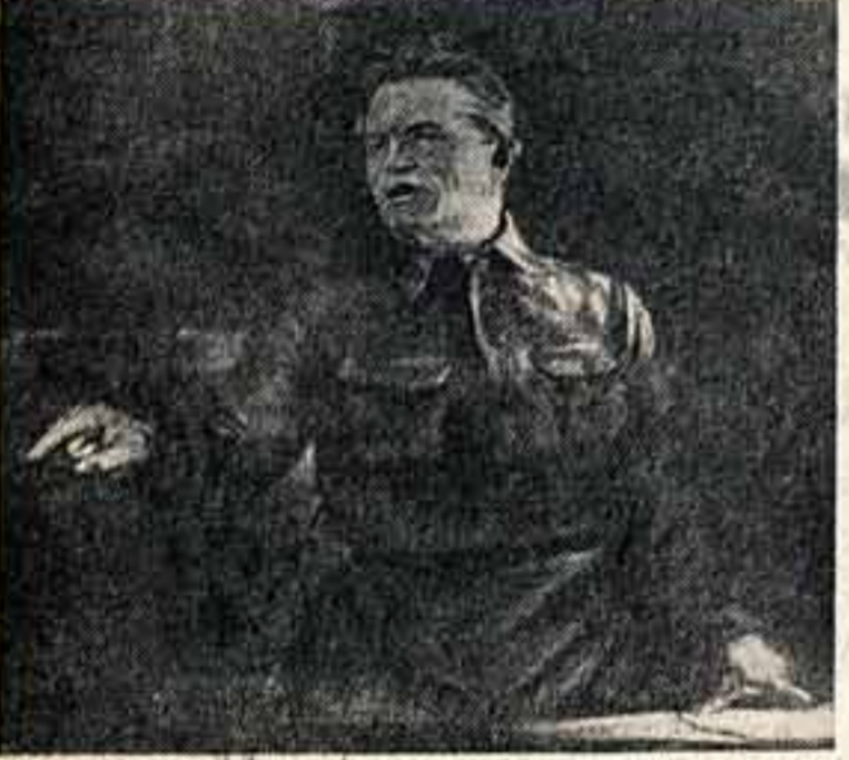
С. М. Киров. Художник Н. Заверин