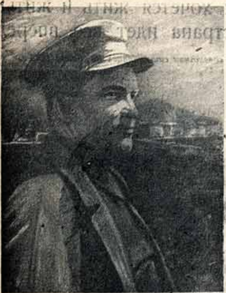
С. М. Киров. Художник Г. Гордон