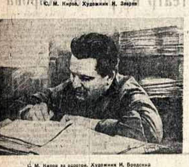
С. М. Киров за работой. Художник И. Вродский