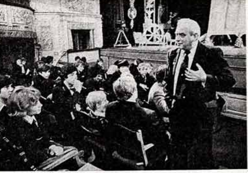
В человеке все должно быть прекрасно, и снаружи его должно быть прекрасно. Природа, архитектура, поэзия, музыка, живопись. Об этом на протяжении многих веков мечтали лучшие умы рода людского, за это беззастенчиво боролись лучшие умы человечества. Но только реальным социализмом, только поступательным движением и коммунизмом может быть достигнута эта благородная цель. Основанной Законом нашей жизни.