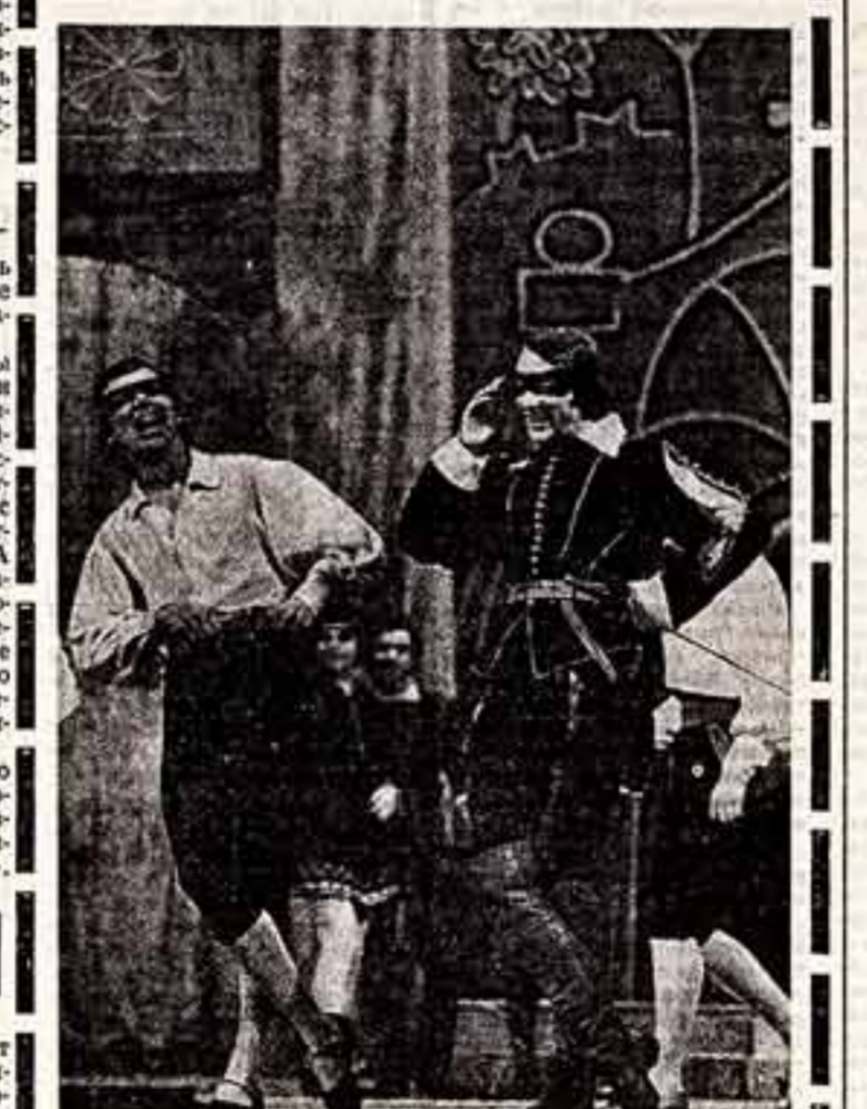
Принятый сюрпризом для ленинградских театралов стала новая постановка комической оперы Ф. Зуппи «Боккаччо», которая уже много лет не шла на сценах театров города на Неве. Постановка ее под руководством заслуженного деятеля искусства Узбекской ССР Л. Мейсала студенты отделения музыкальной школы имени Н. А. Римского-Корсакова при Ленинградском консерватории. Государственная комиссия приняла работу выпускников с оценкой «отлично».

Юные ленинградские танцовщицы завоевали большой приз «Белые ночи-75» на завершившемся в Ленинграде смотре хореографических училищ страны. Два другие награды фестиваля искусства «Белые ночи» — за оригинальность композиции и исполнительность молодые посланцы Белоруссии и Азербайджана. Специальной награды удостоено саратовское училище, воспитанник которого показал на смотре хореографическую композицию «Молодогвардейцы», посвященную 30-летию великой Победы.