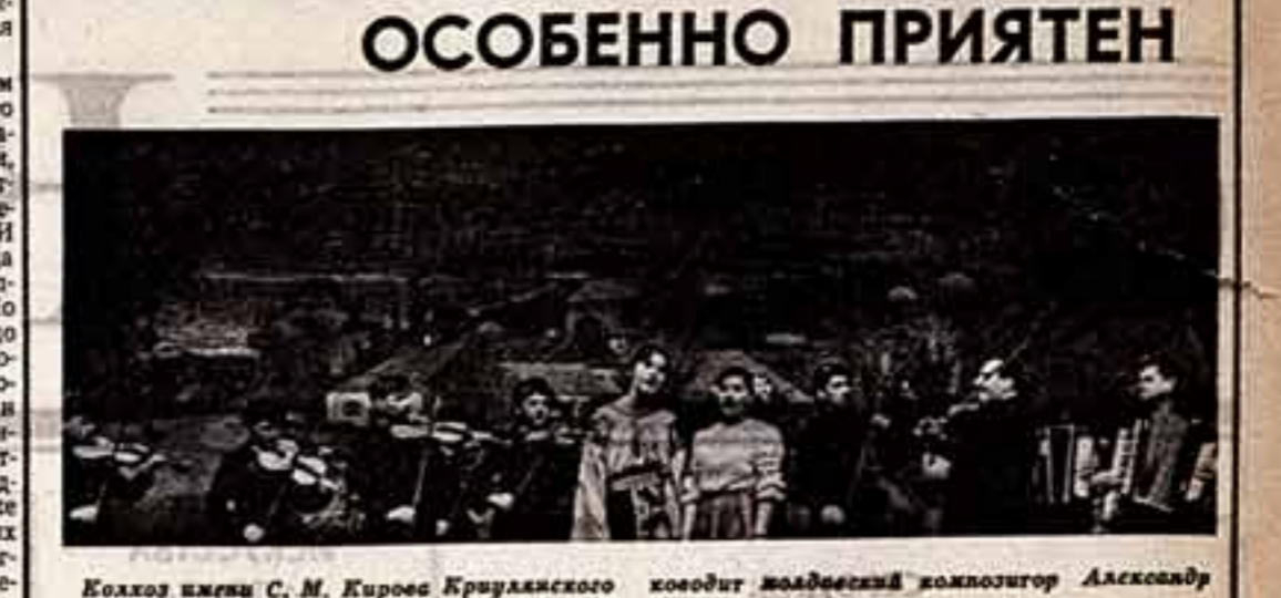
Колхоз имени С. М. Кирове Кривлянского района Молдовы — одно из крупнейших колхозов республики. Хорошо трудятся колхозники, и тем более им приятно, когда в страдную пору покосится на колхозном стане...