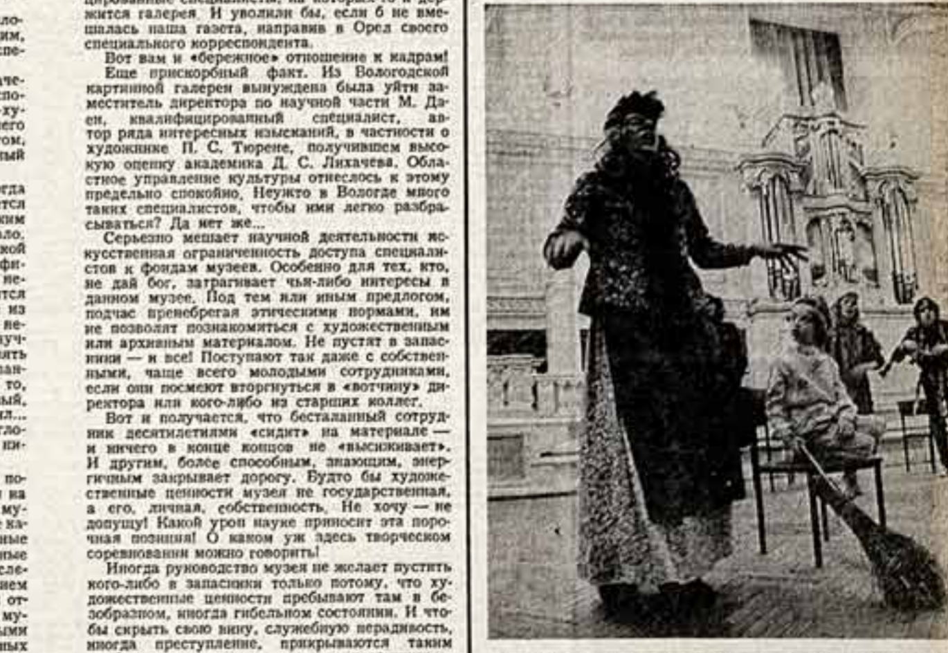
Сцена из спектакля «Наша десятая ночь».