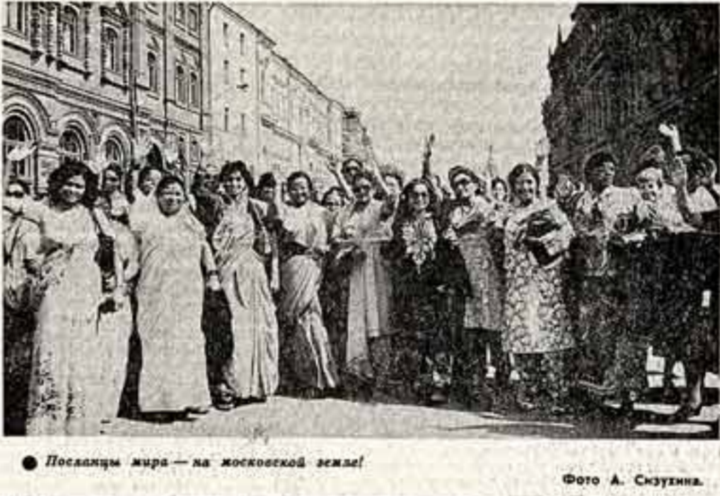
Посылки мира — на московской земле!