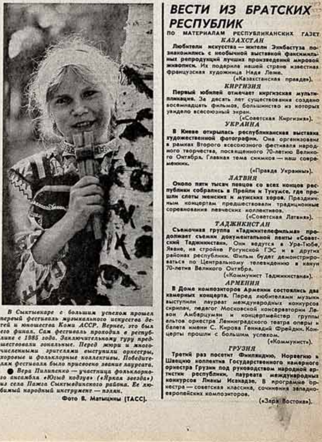
В Сыктывкаре с большим успехом прошел первый фестиваль музыкального искусства детей и молодежи Коми АССР. Вернее, это был его финал. Сам фестиваль проходил в республике в 1985 году. Заключительную турпю представляли зональные. Перед жюри и многочисленными зрителями выступили оркестры, хоры и фольклорные коллективы. Победители фестиваля были удостоены звания лауреата.