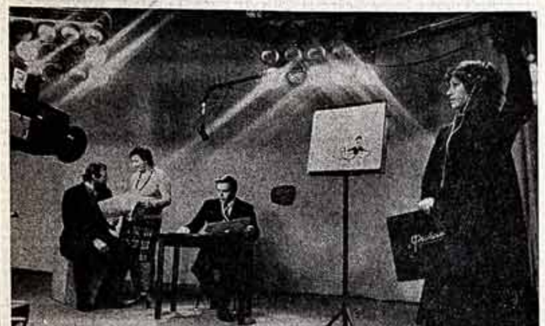
Пензенская студия телевидения постоянно расширяет тематику программы...