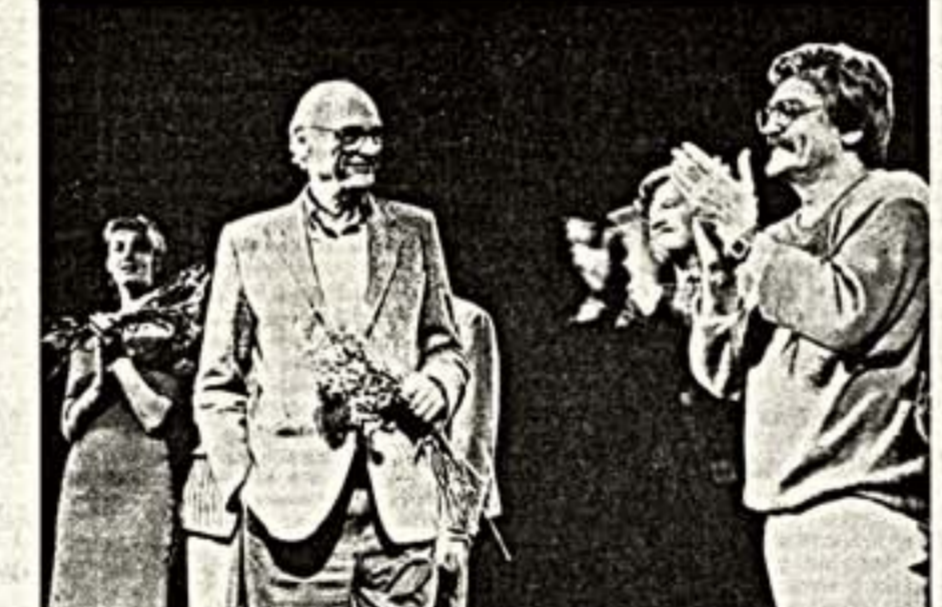
«ЖИТЬ НЕ БОЯСЬ...» АРТУР МИЛЛЕР НА МОСКОВСКОЙ ПРЕМЬЕРЕ СВОЕЙ ПЬЕСЫ «ПОСЛЕ ГРЕХОПАДЕНИЯ»