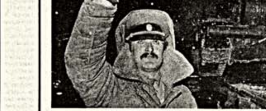
Разрядки наконец от понятия абстрактного и декларативного становится реальным и зримым. Совсем недавно мир, как ребенок, радовался первым взрывам, ликвидировавшим ракеты. Теперь самоочищение человечества от ядерного отравления вводит не просто в привычку, превращается в осознанную необходимость.

Требования, в общем, справедливые. И в горисполкоме, долго не раздумывая, пообещали: храм вернем, надо только высылить кинематографистов, они авноз тому, что храм, мол, вам не возращают. Христиане, зато люди и терпеливые, но тут не разобрались