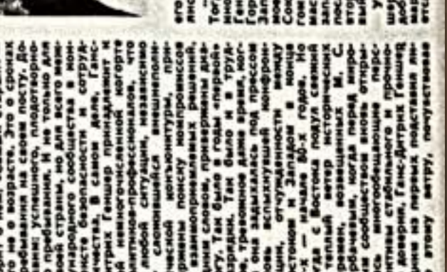
Портрет министра информации...