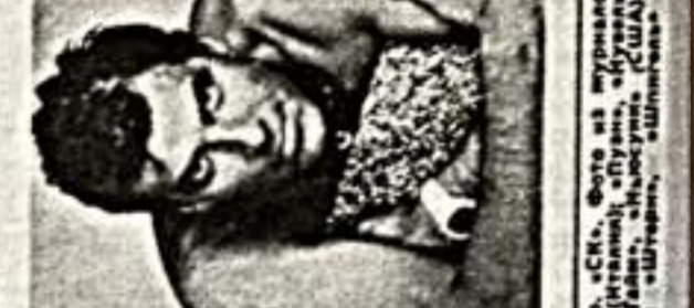
Портрет министра информации... Фото из журналов «Правда», «Известия», «Коммунист», «Советский спорт», «Труд», «Крестьянин», «Рабочий и колхозник», «Культура», «Молодежь», «Жизнь», «Здоровье», «Сельский хозяйство», «Наука и техника», «Искусство», «Музыка», «Театр», «Кино», «Средства массовой информации», «Спортивная жизнь России», «Олимпийский огонь», «Паралимпийские игры», «Десятилетия СССР», «100 лет Великой Октябрьской социалистической революции», «10 лет Октября», «10 лет Победы», «10 лет Советской власти».

«Самый старый министр информации» — это не только название популярной программы, но и название популярной программы, но и название популярной программы.