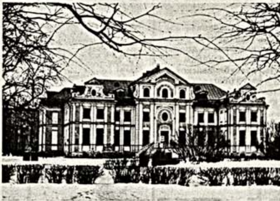
● Книжки в алатах.