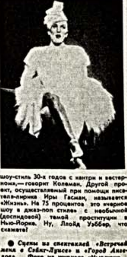
Сцены из спектаклей «Встречи» и «Город Ангелов».