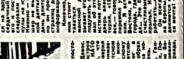
Портрет министра информации... Фото из журналов «Правда», «Известия», «Коммунист», «Советский спорт», «Труд», «Крестьянин», «Рабочий и колхозник», «Культура», «Молодежь», «Жизнь», «Здоровье», «Сельский хозяйство», «Наука и техника», «Искусство», «Музыка», «Театр», «Кино», «Средства массовой информации», «Спортивная жизнь России», «Олимпийский огонь», «Паралимпийские игры», «Десятилетия СССР», «10 лет Великой Октябрьской социалистической революции», «10 лет Октября», «10 лет Победы», «10 лет Советской власти».