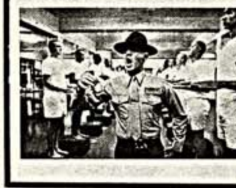
Крупнейший американский режиссер Стэнли Кубрик прославился во всем мире как автор острых тем, разоблачающих ужасы войны...