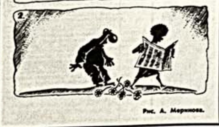
Рис. А. Мерникова.