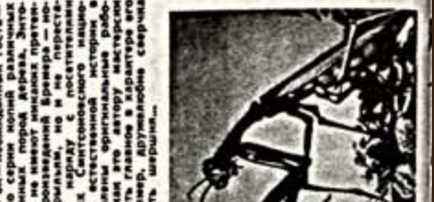
Портрет министра информации...