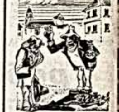
Рисунки К. Рыбаков.