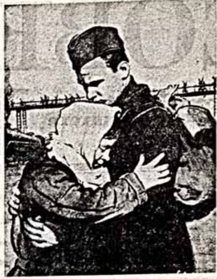
Он ненавидел войну