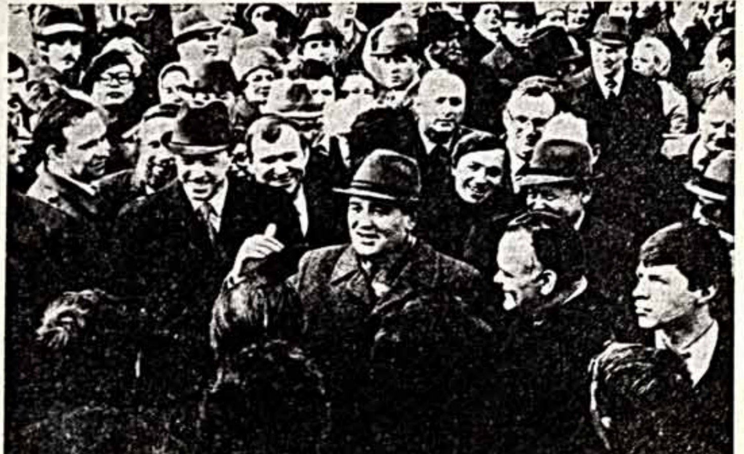
На Куйбышевском металлургическом заводе имени В. И. Ленина. Во время беседы с заводчанами.

«После четырехдневного перерыва, понижавшегося для устранения последствий разрушительного землетрясения, возобновил работу Кабардинский кооперативный комбинат».