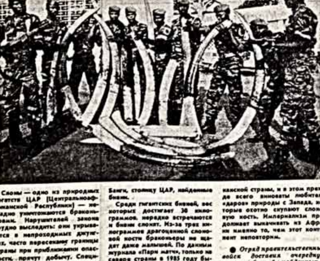
Богаты — одно из природных богатств ЦАР (Центральноафриканской Республики) — недавно уничтожены браконьерами.