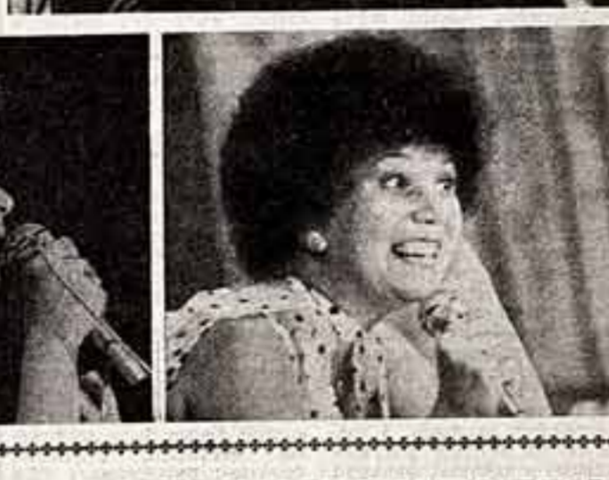
Телефона А. Обуховского.