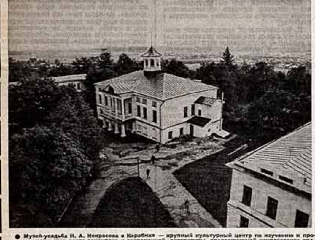
Музей-усадьба Н. А. Некрасова в Нарытах — крупный культурный центр по изучению и пропаганде творчества поэта-демократа и современной литературы, продолжателем некрасовских традиций.