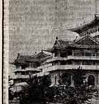
Нартия и правительстве Корейской Народно-Демократической Республики большое внимание уделяют повышению уровня образования народа. Одной из наиболее популярных центров культуры КНДР сейчас является Народный дворец учебы, возведенный в Пхеньяне. Дворец располагает читальным залом на 5.000 мест, в кинозрительном центре содержится около тридцати тысяч томов.