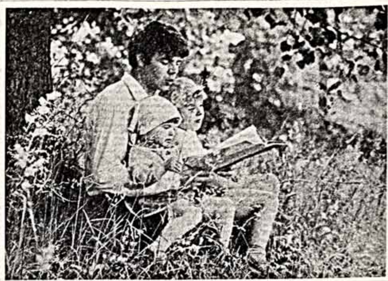
● В. СКОРНИН. «Сказки доброго вальса».