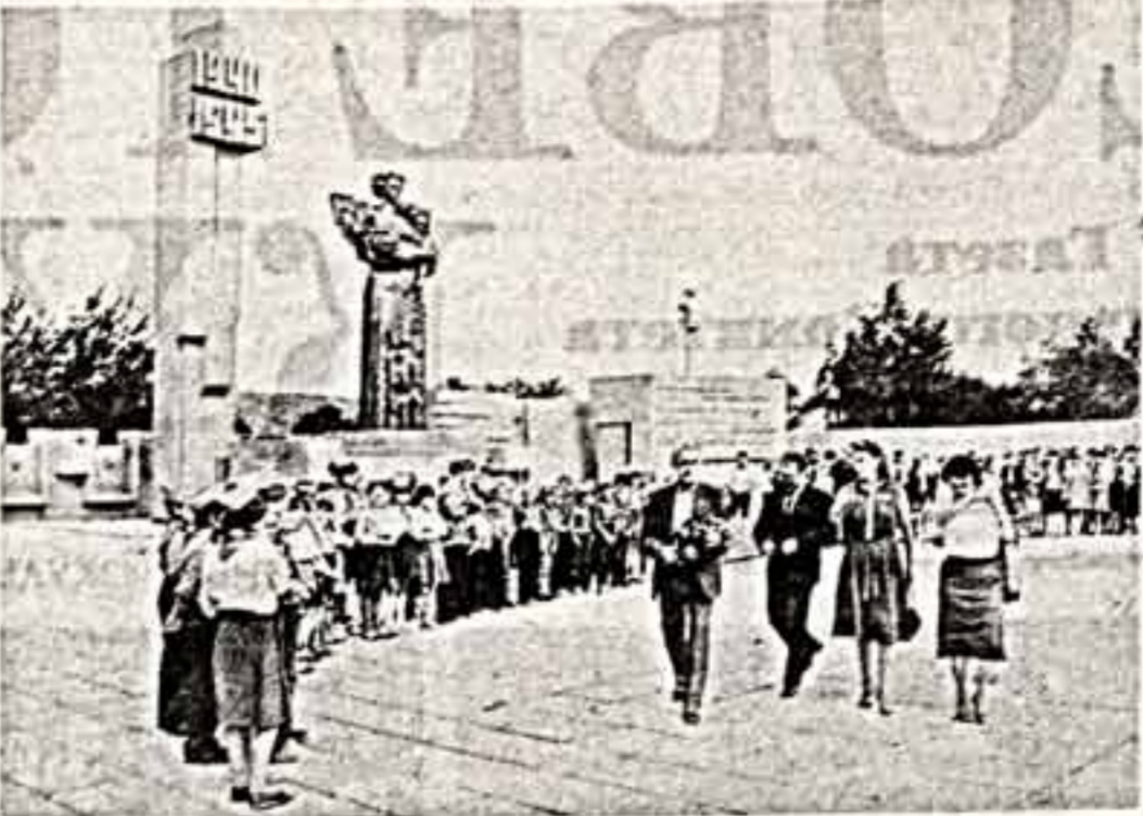
3. АРЕВШАТЯН. ЕРЕВАН.

По сообщениям корреспондентов «Советской культуры» и ТАСС