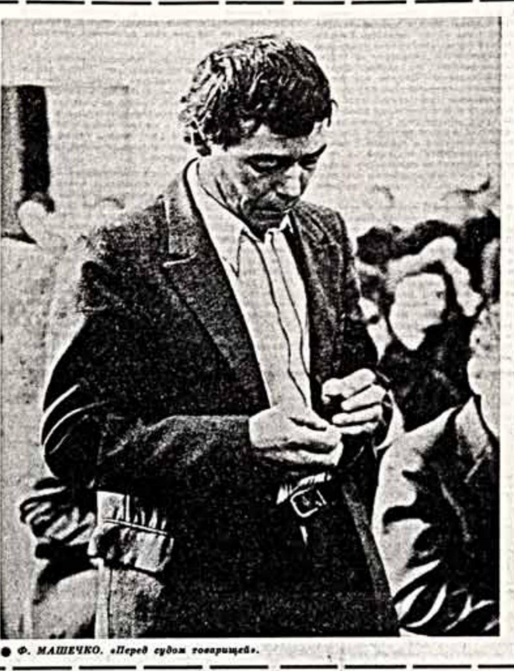
Ф. МАШЕЧКО. «Перед судом товарищей».

И. СИДОРОВА, ДУБАНА, Московская область.