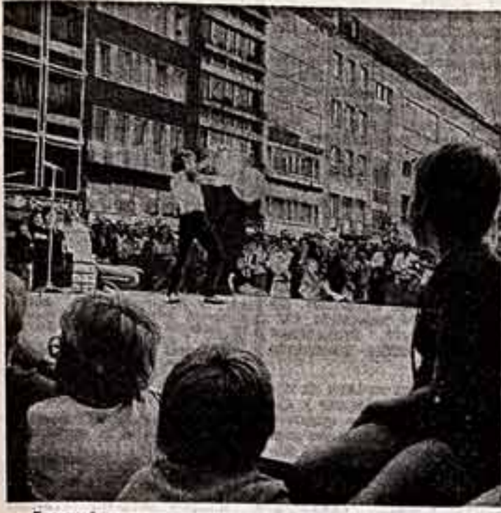
Большой успех выпал на долю ансамбля художественной самодеятельности профсоюз СССР, который выдвинулся в ФРГ по приглашению баварского общества «ФРГ - СССР». Участники ансамбля были представителями разных городов художественного Советского Союза — из Горького, Кинешвы, Врета, Ярославля и Москвы. Программа включала народные песни и танцы, пантомиму, Западногерманские выступления, также принимали участие артисты-любители, выступавшие прямо на площадке. Москва, Скарлатина, Бонна.