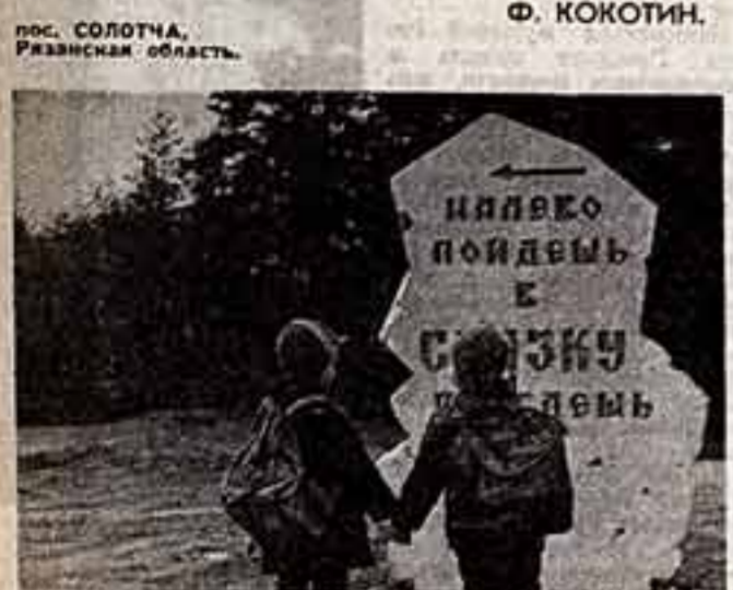
На вершине туристских дорог.

Этот необычный указатель приглашает юных путешественников... Места дивной красоты. Солотча — излюбленное место отдыха горожан.