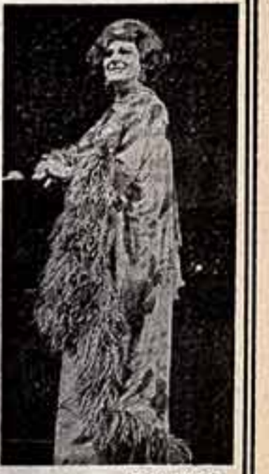
Рената Тебальди.