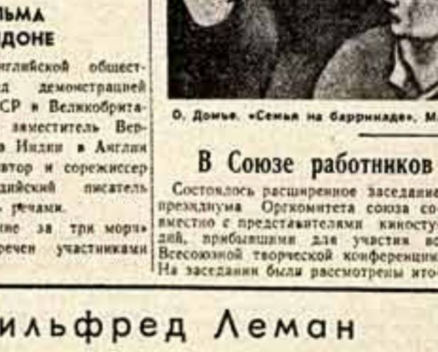
О. Домье. «Семья на баррикаде». Масло.