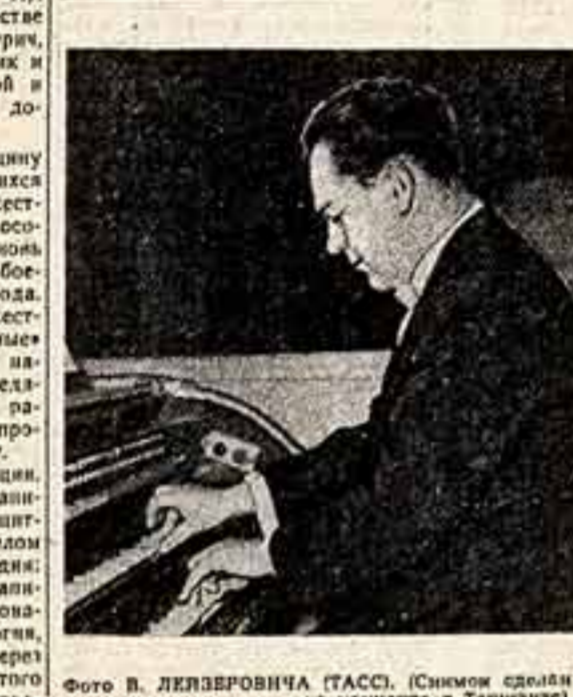
(Снимок сделан на концерте в Ташкенте).