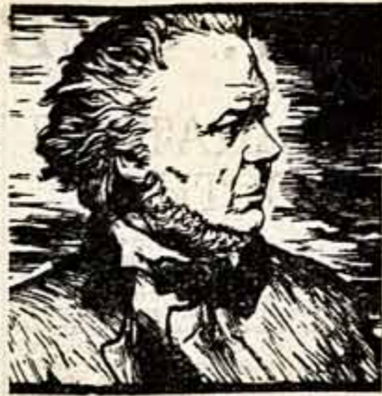
Ороне ДОМЬЕ. Гравюра М. Калитина (фрагмент).