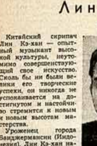
Китайский скрипач Лин Кэ-хан