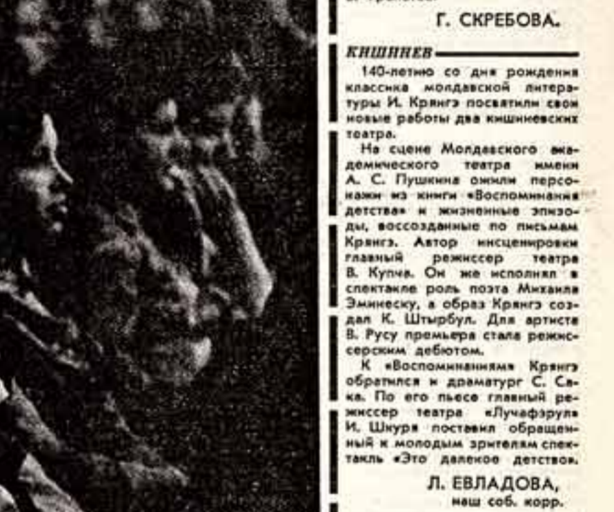
Д. А. ШМАРИНОВ.

О. ВЕРЕЙСКИЙ, народный художник РСФСР, член-корреспондент Академии художеств СССР.