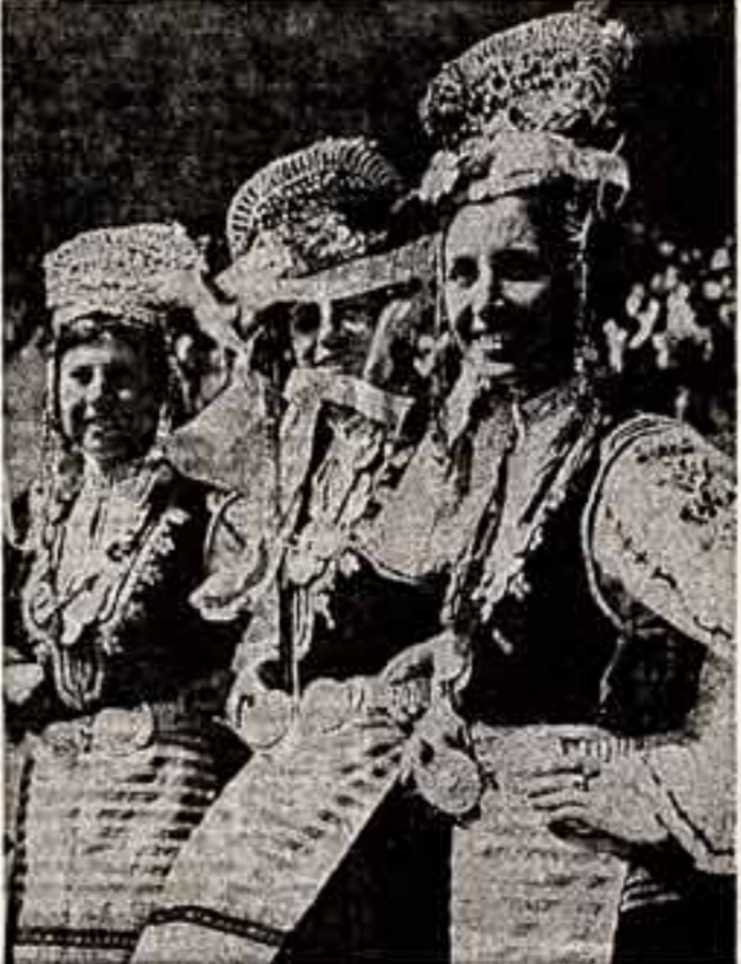
«Республика мастеров художественной самодеятельности» — так называет в последние времена Болгария мировую встречу, отмечая высокий уровень развития талантов в болгарской республике.

В настоящее время в Болгарии насчитывается около семидесяти тысяч коллективов художественной самодеятельности, в которых принимают участие более четырехсот тысяч человек. Многие типичные и летние коллективы получили высочайшее международное признание, были удостоены наград и отличий международных конкурсов и фестивалей художественного искусства.