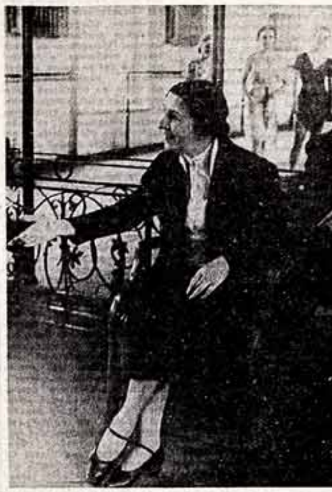
Агриппина Яковлевна Ваганова

Ваганова создала новые редакции балетов «Лебединое озеро» и «Эсмеральда», которые явились эталонными спектаклями и вошли в историю хореографии. Ни одна из дальнейших редакций «Лебединого озера» не обходилась без ее находок и открытий. Сохраняются они и в нынешнем варианте этого