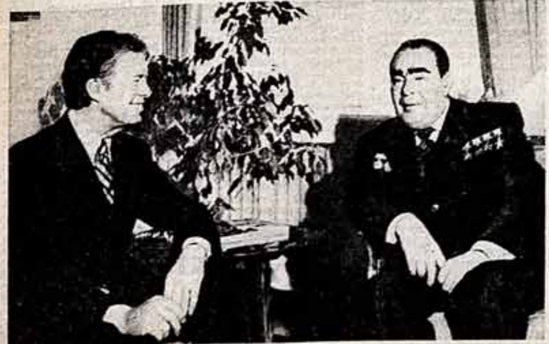
Во время встречи.