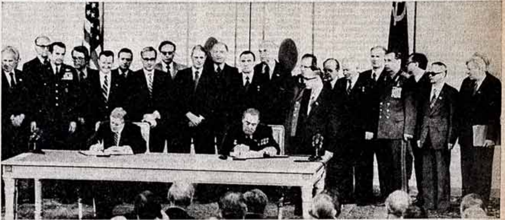
При подписании документов.