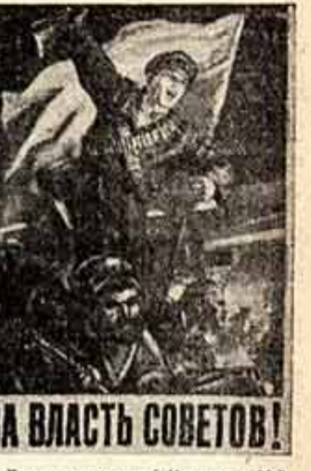
Плакаты, выпущенные Изогномом к 38-й годовщине Великой Октябрьской социалистической революции...