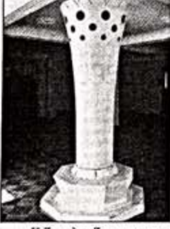
Н. Леонидов. Дворец пионеров в Твери. Колонна в зале 2 этаж