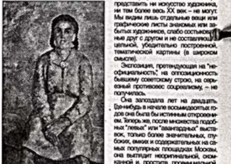
Верху: А. Волков. "Дорога в горы". 1930 — 1931 гг. Внизу: Р. Фальк. "Портрет девочки в красном". 1952 г.