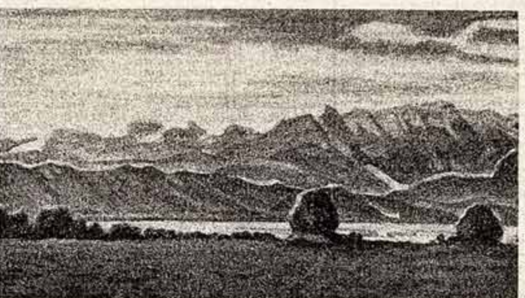
Г. Айгис. «Утро в горах».