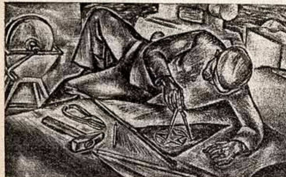
А. Максимов. «Металлической вышлепа».