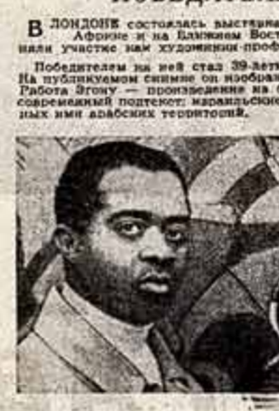
В ЛОНДОНЕ состоялась выставка работ 250 художников, живущих в Африке и на Ближнем Востоке...