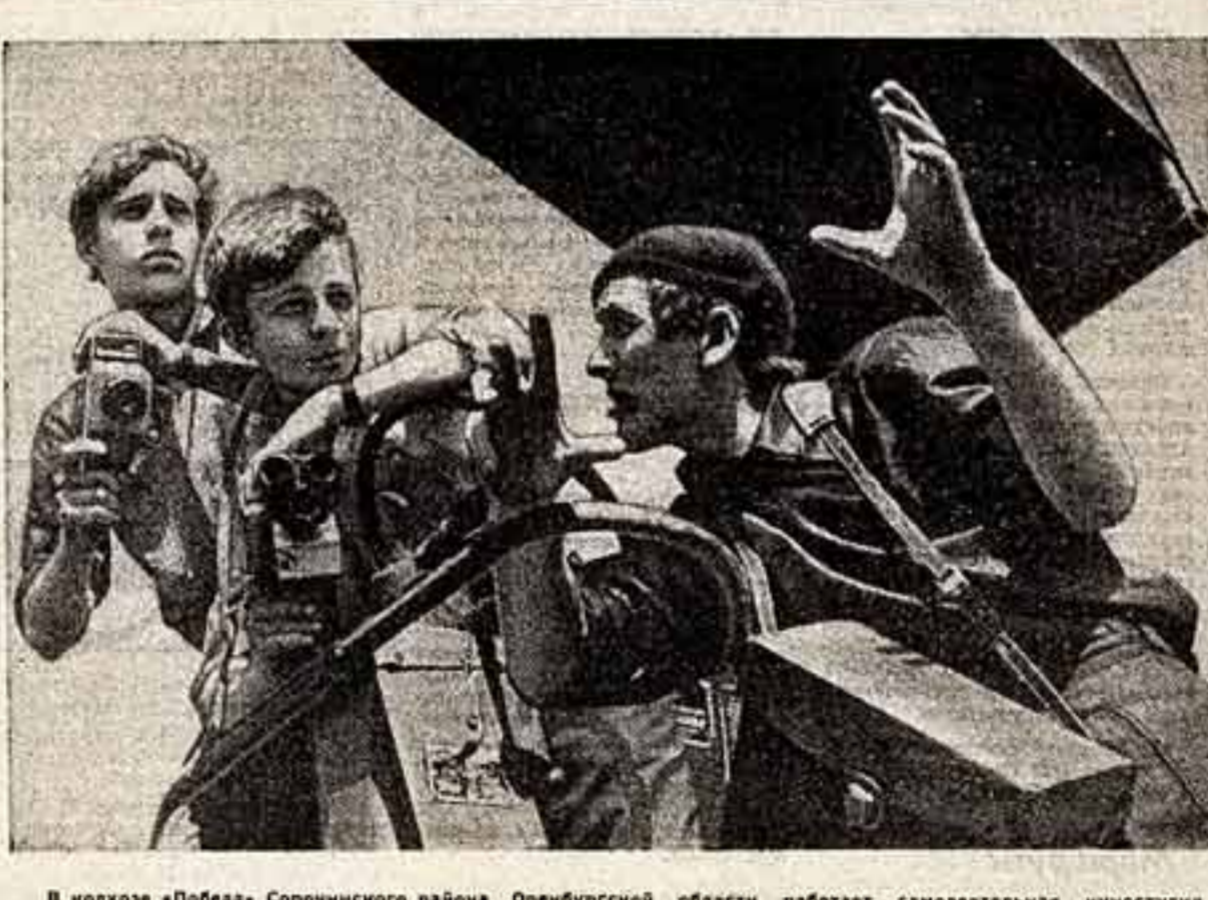
В колхозе «Победа» Сорочинского района Оренбургской области работает самодеятельная инновационная студия «Колос».