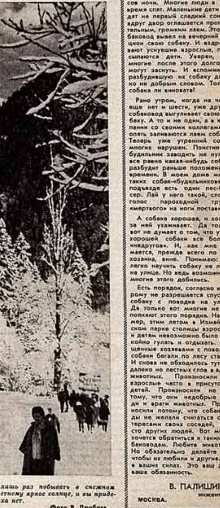
Принято считать, что время отгулков — лето. Но стоит лишь раз побывать в снежном Домбее, где встретились причудливые узоры зимы и по-летнему яркое солнце, и вы убедитесь, что лучшего времени, чем зима, для отдыха нет.