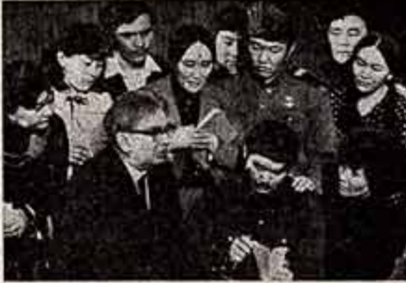
Участники дипломного спектакля Якутской студии Театрального училища имени М. С. Щепкина с авторской пьесы «Золотая карета» Леонидом Леоновым.