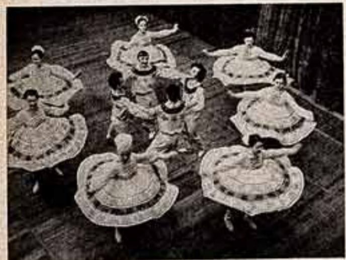
«Сибирские узоры» исполняет танцевальный коллектив ансамбля «Взглядники» дворца культуры «Нефтяники» из Ангарска (Иркутская область).