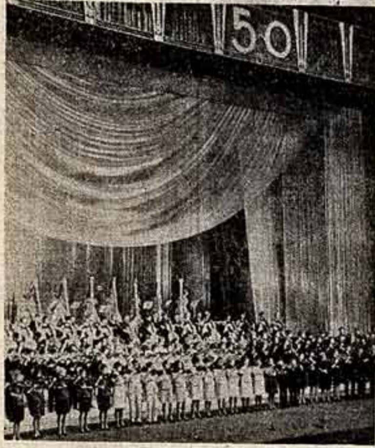
Вчера в Кремлевском Дворце съездов.

ГОВОРИЯ в канун юбилея Советской власти о том, каким светлым, радостным, что зат вим Октябрь, мы поздравляем какие-то новые слова и выражения, сравнения и эпитеты, так более полно рисующие картину тех поистине огромных свершений и открытий, которые принесли нам, советским людям, победа Октября. И