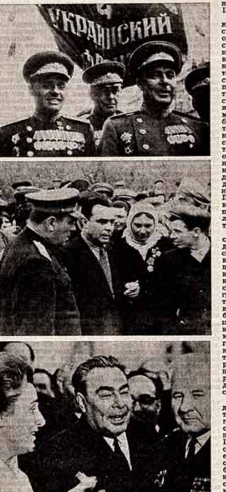
Кадры из нового телевизионного фильма «Ленинским путем».

бо отличившихся воинов, сражающихся ради мира на Земле, видим Леонида Ильича Брежнева. Война завершилась великой Победой. Но бой продолжался — бой с разрухой, бой за восстановление городов и заводов, колхозов и домашних печей, школ и больниц. Перехватывает горло, когда опять видишь взорвавшуюся плотину Днепродзержинска, изуродованные металлургические перевертыши цехов... Все это нужно было восстановить! Первый секретарь Запорожского областного комитета партии Л. И. Брежнев переносит свой кабинет прямо в цех: одну из взорвавшихся печей решено было восстановить за пять часов вместо двух месяцев. Снептили в это не верили: подобная опе-