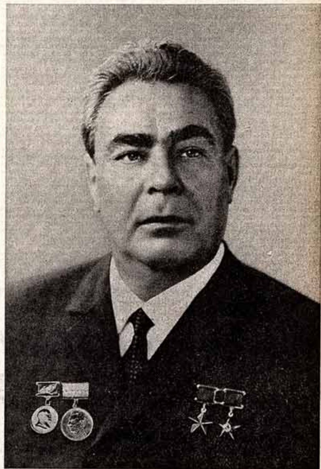
Леонид Ильич БРЕЖНЕВ

Указ Президиума Верховного Совета СССР О награждении Генерального секретаря ЦК КПСС Героя Советского Союза, Героя Социалистического Труда товарища БРЕЖНЕВА Леонида Ильича орденом Ленина и второй медалью «Золотая Звезда»