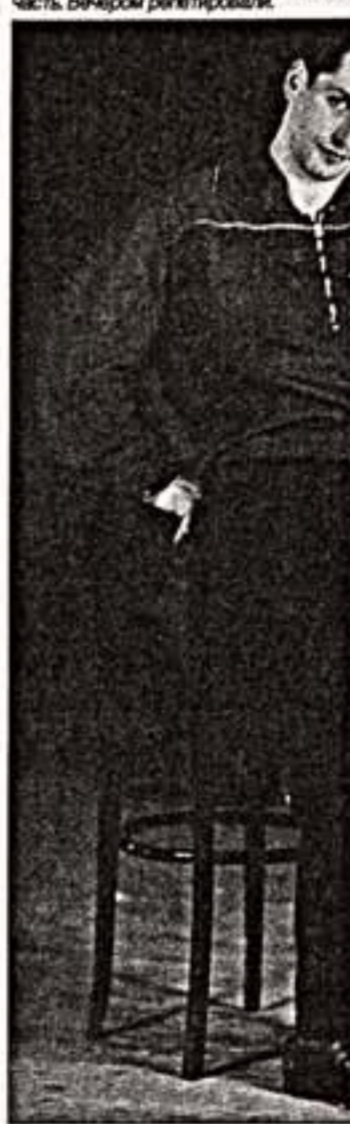
И.Моисеев, 1930-е гг.

платили блестяще и чисто. Я сам впервые увидел, что выступление получило. Косарев полагает. Вечером был концерт ансамбля для соснов Верховного Совета. Прошло блестяще. Удалый день. 21 июля 1938 г. Дождем в институте. Ночью состоялась обща репетиция на Красной площади. Ленинград - слава Украине! как на театральной. Белорусия - хороша земля. 22 июля 1938 г. Вечером мотоциклы застряли на мосту - думали новые силы. Был в Комитете фидулярный, ошел с себя ответственность за хозяйственную часть. Вечером репетировали.