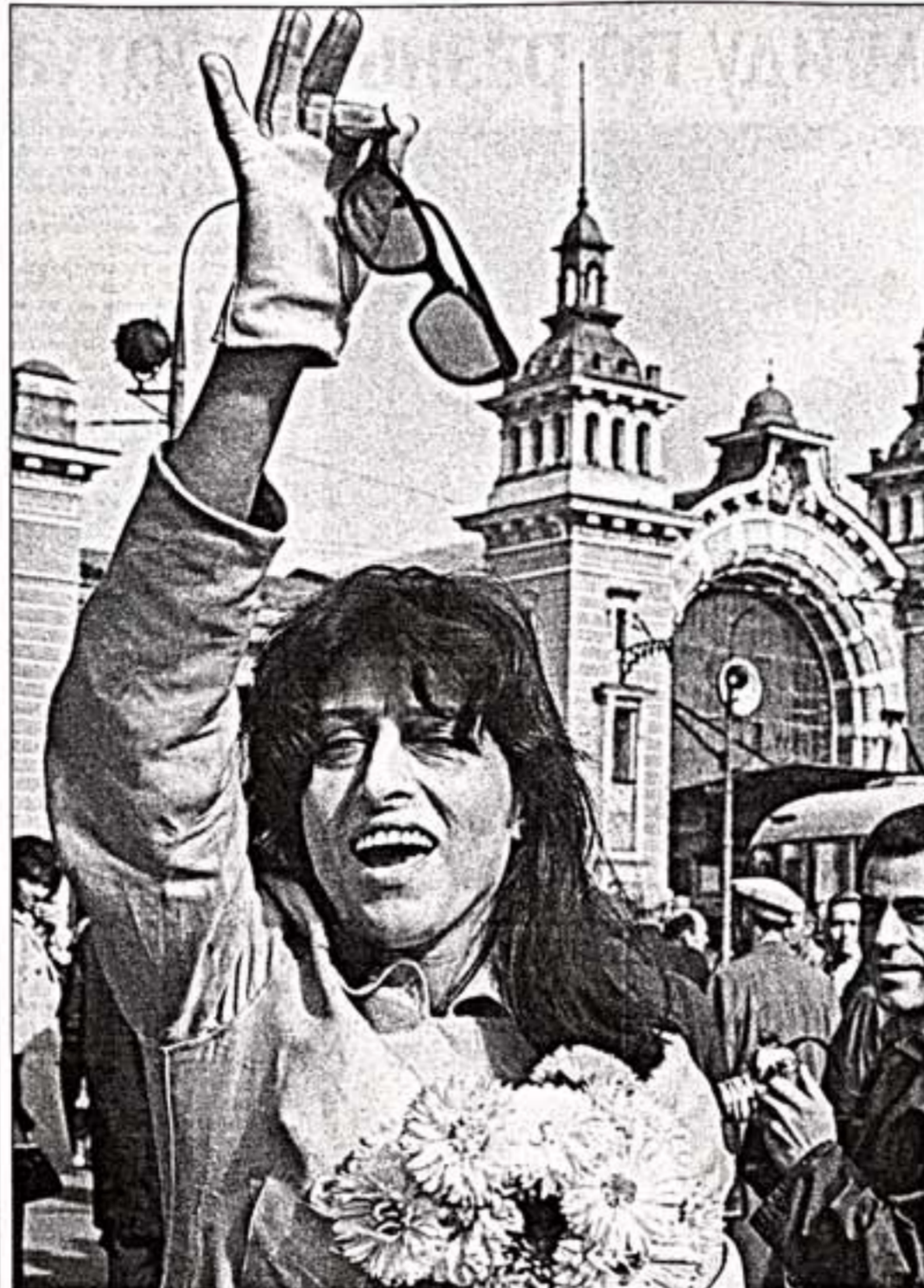
А. Маньянина в Москве. 1966 г.