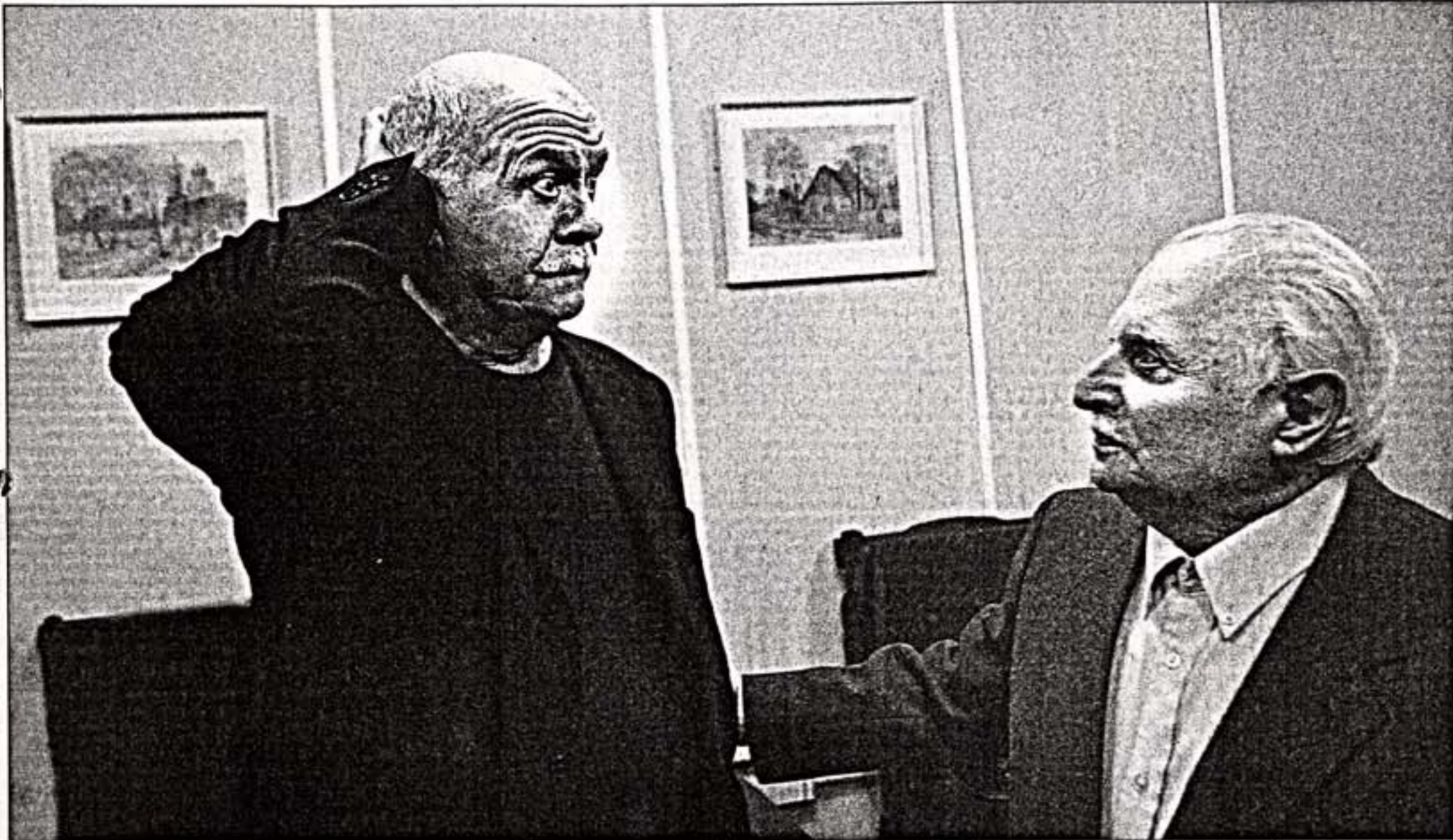
Режиссер С.Говорухин и композитор И.Шварц воспользовались встречей на Гатчинском фестивале для обсуждения проблем отечественного кино

Призы XIV Российского фестиваля "Литература и кино"