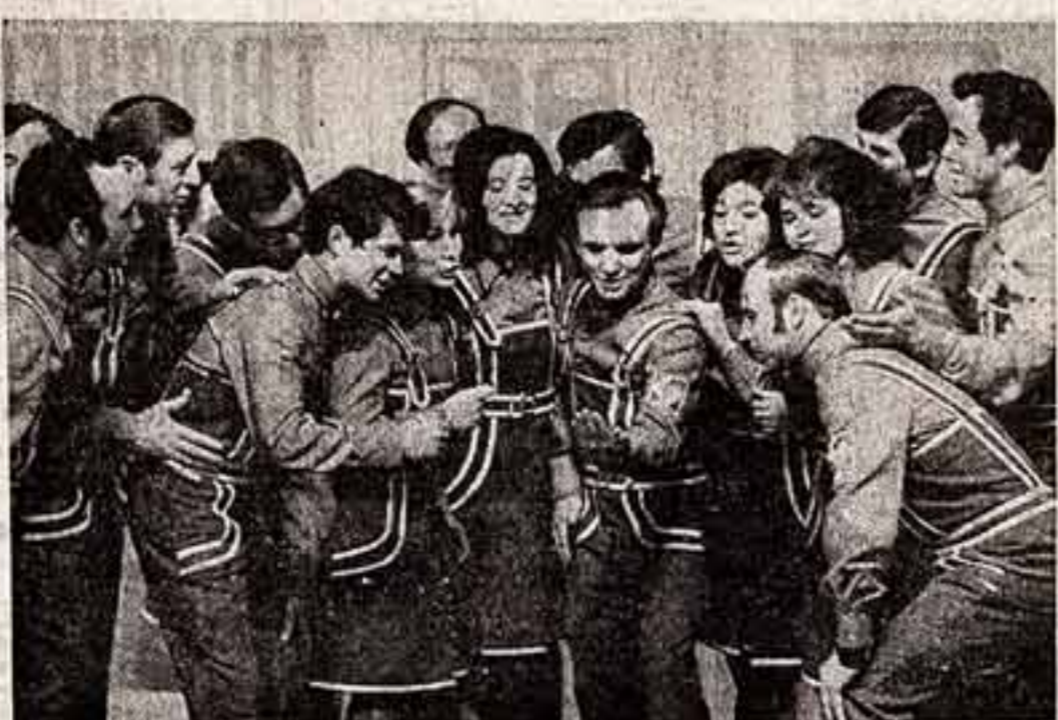
Выступает агитбригада Рыбинского моторостроительного завода.

Агитбригада — боевой жанр. Агитбригады — походы и проделки легендарных «спецбуззиков».