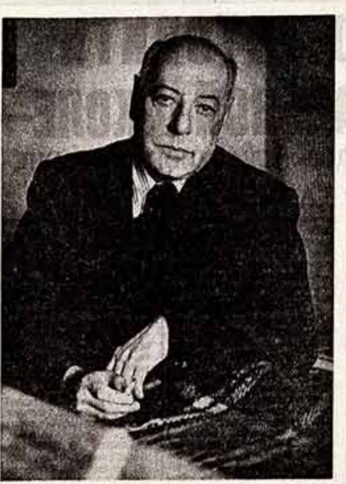
люди искусства ПОСТОЯНСТВО Сергей ЮТКЕВИЧ, Герой Социалистического Труда, народный артист СССР