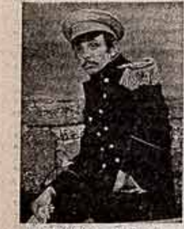
Нескорый — О. Дале.