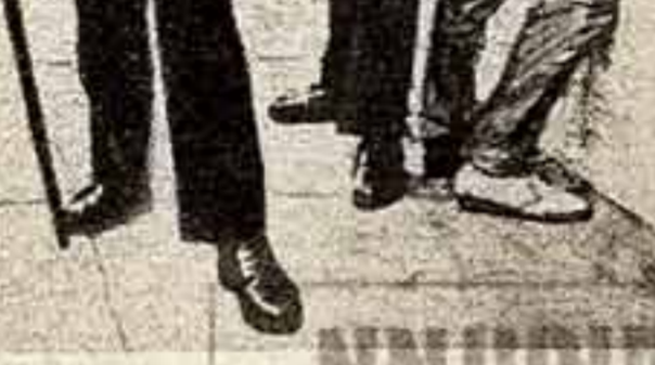
Эта фотография была сделана в прошлом году в Сан-Франциско (Калифорния) во время визита полиции студенческой демонстрации против войны во Вьетнаме и за гражданские права индейцев.