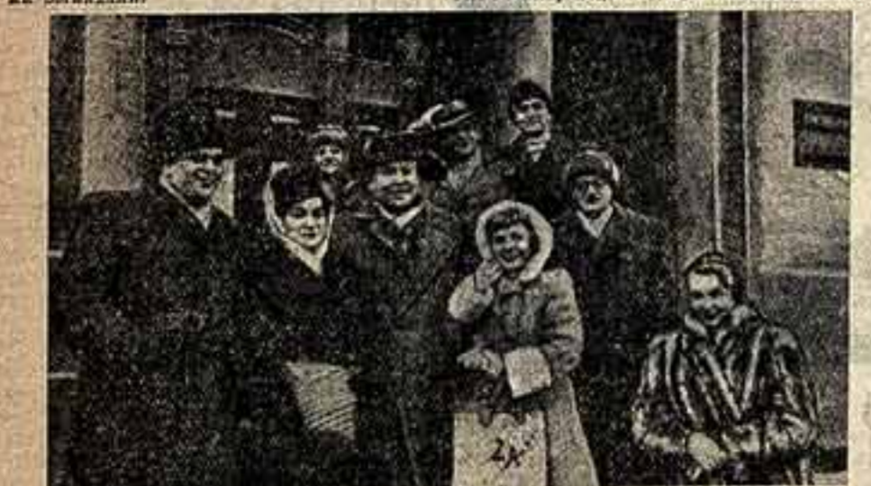
На снимке: группа артистов Венгерской оперетты, у гостиницы «Ленинградская».

Мы случайно познакомились с артисткой Будапештского театра оперетты — так, как обычно знакомятся в поезде пассажиры, и спустя несколько минут в четырехместном купе, где собралось человек десять-двадцать гостей из Венгрии, уже царил та дружеская, непринужденная обстановка, которая всегда сопутствует в дороге людям с общими интересами и общими взглядами.