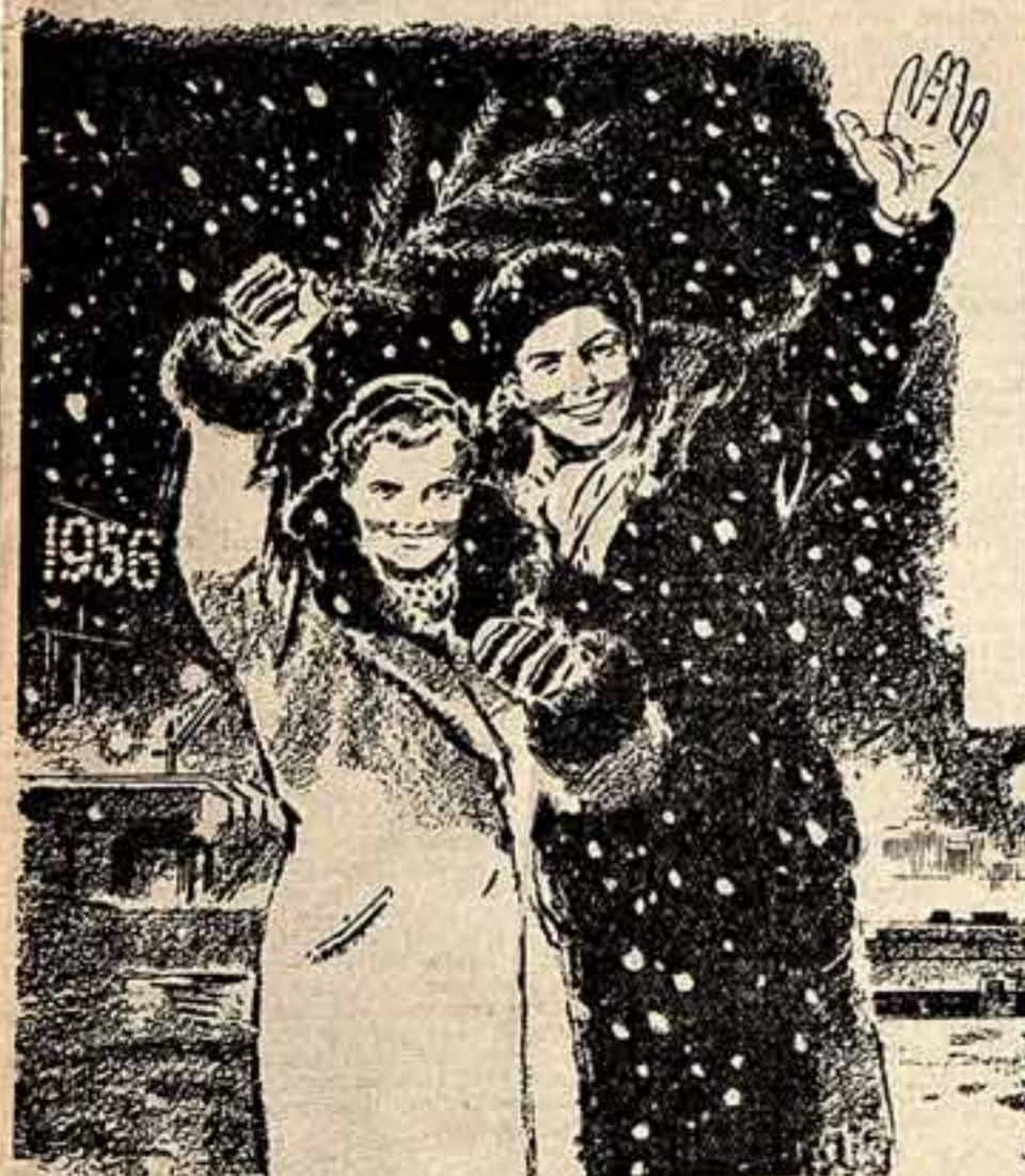
Рисует В. Шелюва.