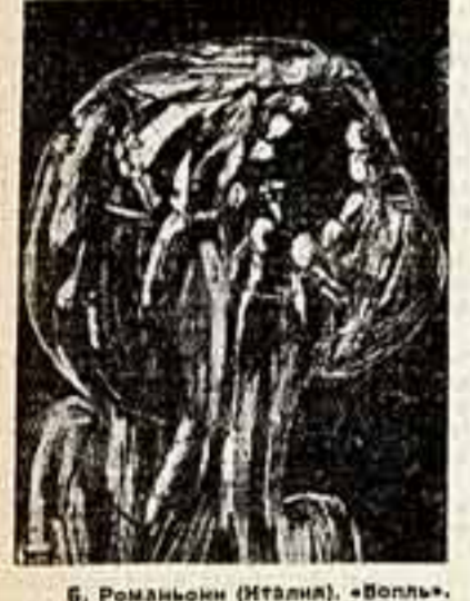
Б. Романоли (Италия). «Волпы».