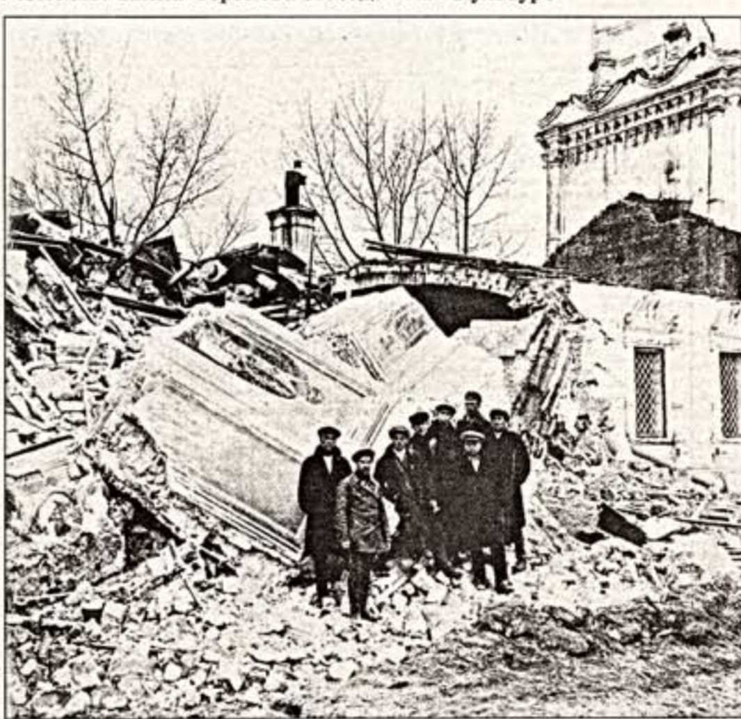
Фото на пленку. 1918 г.

Впрочем, это "участие" стоило от-ду Павлу жонги, спустя несколько лет после сергиевского события он был арестован и отправлен на Соловки, где и закончил свой земной путь в бараче бывшей (на то мо-мент) Финляндской пустыни.