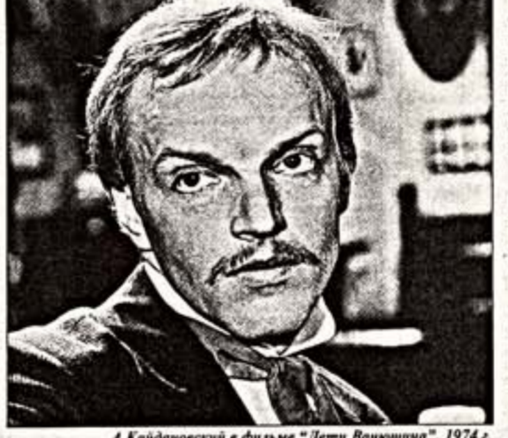
А.Кайдановский в фильме "Дети Ванюшина". 1974 г.

Безспорно, пропугавшая по Сул-товскому бульвару он оставалась