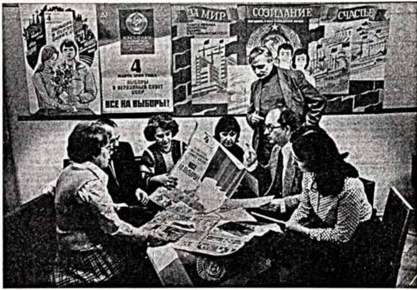
Около 100 наименований различных видов избирательной продукции подготовлено издательством ЦК КПСС «Плакат» к выборам в Верховный Совет СССР.