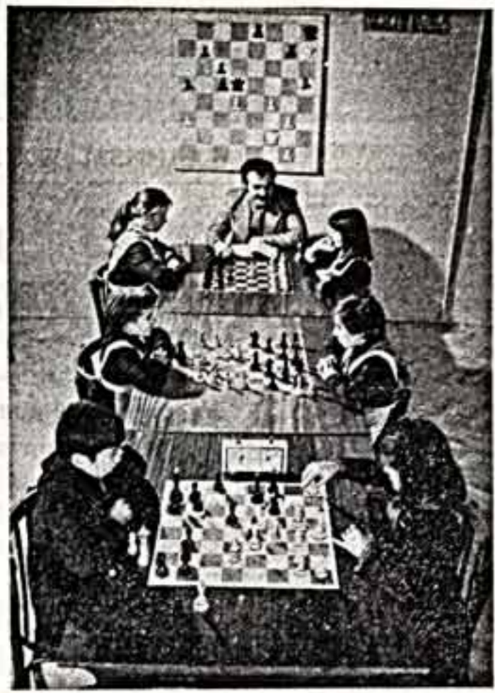
К 40-ЛЕТИЮ ВЕЛИКОЙ ПОБЕДЫ