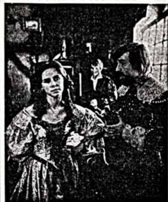
В одной из локальных Одесской киностудии выстроены скамьи для зрителей...

Музыкальный фильм «Дети родились» (сценарий И. Г. Ольшанского) подается во вторник, 17 января, в 19 часов. Автор сценария и режиссер — Владимир Зинченко. В фильме участвуют артисты Одесской киностудии.