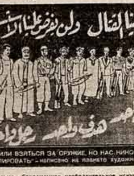
Кадр из диафильма «Современное изобразительное искусство Объединенной Арабской Республики».

Маленькую круглую корбочку из пластмассы, в которой упакован метр черно-белой или цветной пленки, отдалось знаком ребятам во всех уголках страны. Их зоркий глаз находит диафильм, готовый не только к просмотру, но и к высококвалифицированным специалистам постановочной части. Через каждые три-четыре года выпускается 10—15 человек. В Ленинградском театральном институте постановочный факультет только что открылся, а в Учлидзе имени М. С. Щепкина его открыли.