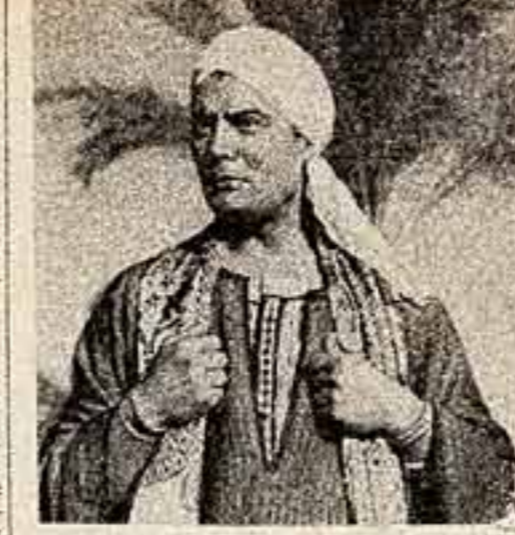
Кадр из фильма «Земля наших отцов» (ОАР).