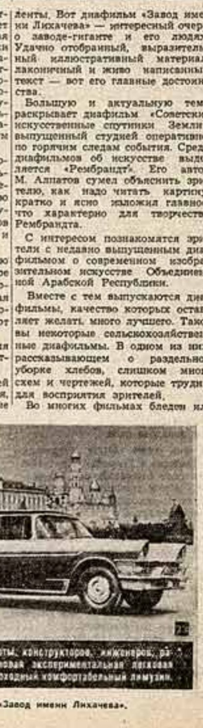
Кадр из диафильма «Завод имени Лихачева».

В результате совместной работы конструкторов, инженеров, рабочих и техники создана новая экспериментальная легковая машина ЗИЛ-111. Это быстробегущий комфортабельный лагуна.