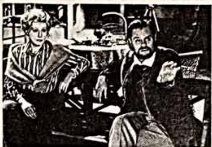
Новая тема которой — одиночество интеллигента в историческом процессе.