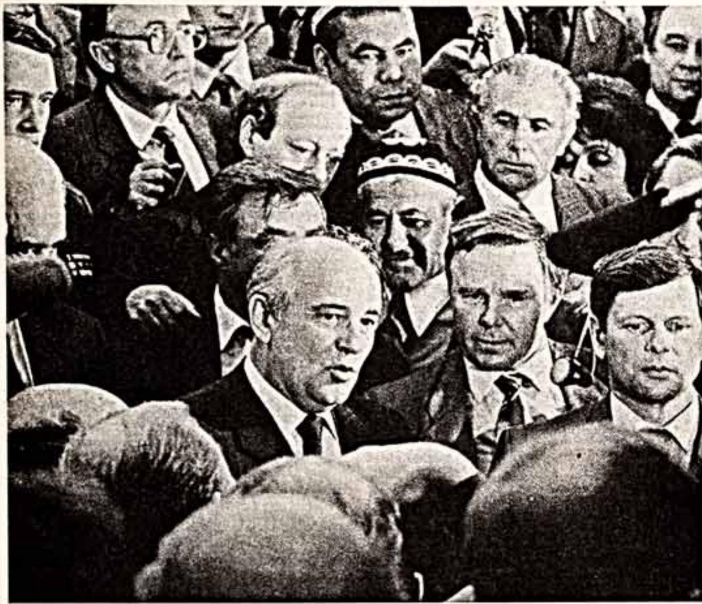
Москва. Съезд народных депутатов СССР.