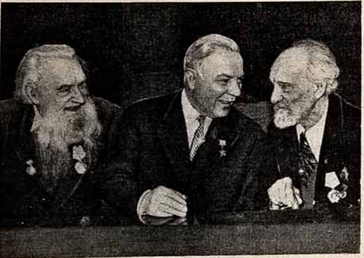
Вчера в Кремле, К. Е. Ворошилов и народные художники СССР С. Т. Коненков и В. Н. Бакшеев.