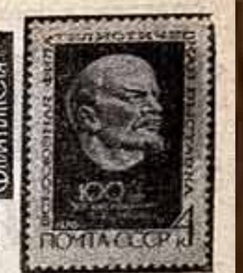
В КОММИКО КОМТЕЛЕСА