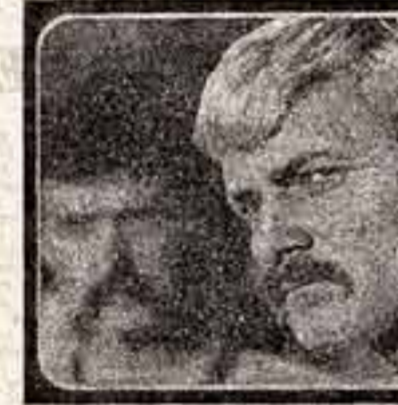
«Дума о Британке»

— Как я отношусь к идее проведения Олимпийских игр в Москве? Более чем положительно. И можно было бы сказать, что время московской Олимпиады совпало с моим отпуском. Тогда я мог бы стать, наконец, полноценным москвичом.