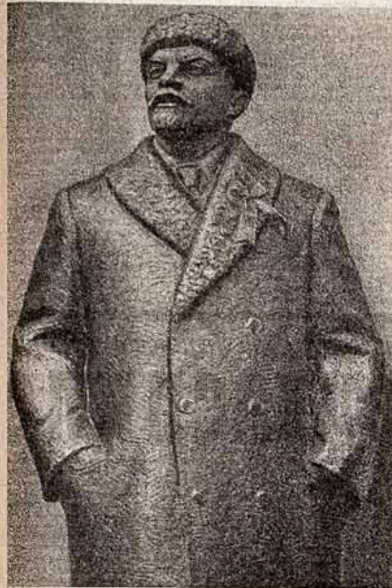
А. Богостойев. «В. И. Ленин, 1918 год».

ОРГАН МИНИСТЕРСТВА КУЛЬТУРЫ СССР И ЦЕНТРАЛЬНОГО КОМИТЕТА ПРОФЕССИОНАЛЬНОГО СОЮЗА РАБОТНИКОВ КУЛЬТУРЫ