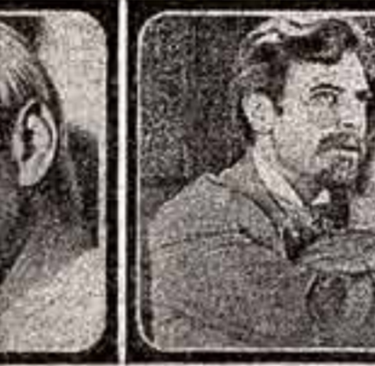
«Дума о Британке»

Эта героическая история, случившаяся в трудном, суровом девятинадцатом году на Херсонских берегах, рассказана известными кинорежиссерами приподнято романтически. «Дума о Британке» — название фильма, как бы подчеркивая свое намерение следовать образцам народной поэзии. События, описанные в фильме, действительно происходили в 1918 году. Ударила в него Белая банда Деникина рвется в Москву. По призыву Ленина весь народ как один встал на защиту молодой Советской республики.