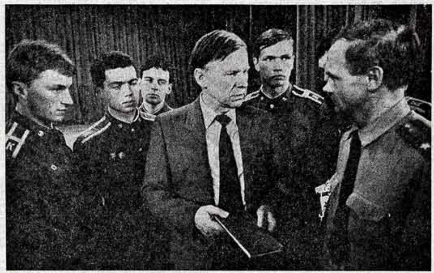
Народный писатель Белоруссии, депутат Верховного Совета республики Василь Быков. Всю войну и еще десять лет после нее писатель был в армии. Василь Быков и сегодня считает себя солдатом. Так живет и так работает. Герой Социалистического Труда В. Быков беседует с куряками Минского высшего военно-политического училища.