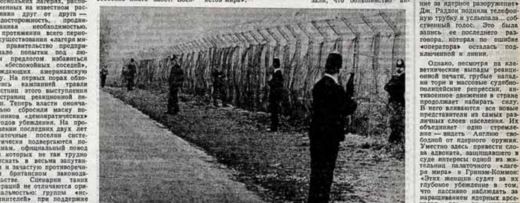
Что круглосуточно охраняют эти рослые английские полицейские, оснащенные высочайшим вооружением и протами в американские танки, размещенные в военных воздушных базах в местечке Гринэм-Коммон. Стоял безразличное отношение и смертоносным боеприпасам «подаркам» отнюдь не уменьшается с насилием и репрессиями против собственных соотечественников, когда дело доходит до разгрома демонстраций антивоенных выступлений против планов НАТО и требующих очистить территорию своей страны от ядерного оружия.

Подоимые утверждения опровергаются самой жизнью. Общеизвестно, что «лагеря мира», подобные парадному городу в Гринэм-Коммон, созданы сейчас фактически у всех крупных ядерных объектов США на британской земле.