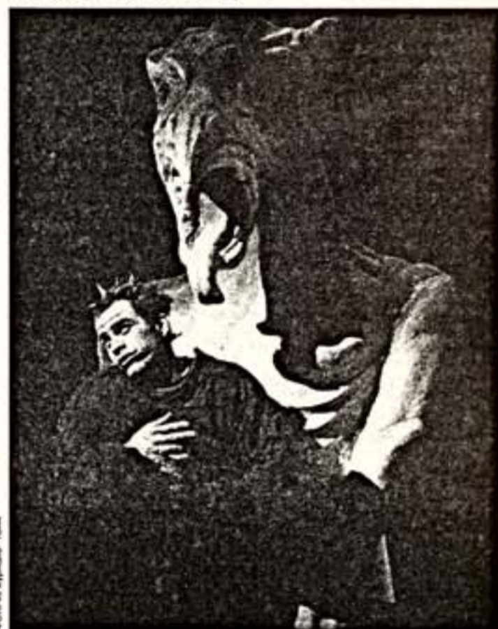
Сцена из спектакля "Собор Парижской богематери"